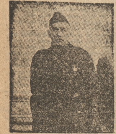
Coronel, miembro del Estado Mayor Provincial, don Antonio Aninat

CONSAGRADA AL SERVICIO DE LA PATRIA Y A LA DEFENSA DEL ORDEN CONSTITUCIONAL, MILICIA REPUBLICANA CUENTA CON EL APOYO Y EL APLAUSO UNANIMES DE TODOS LOS BUENOS CHILENOS. — COMO NACIO ESTA INSTITUCION. — SUS FINALIDADES. — SUS COMIENZOS EN CONCEPCION. — ESTADO ACTUAL DE ELLA EN ESTA CIUDAD Y EN LA PROVINCIA