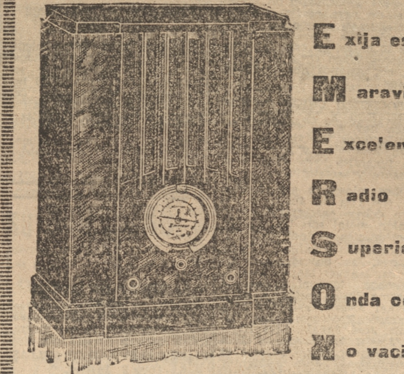
MODELO 555 - SENIOR