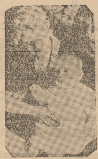
"BABY LINDY" en brazos de su abuela Mrs. Morrow