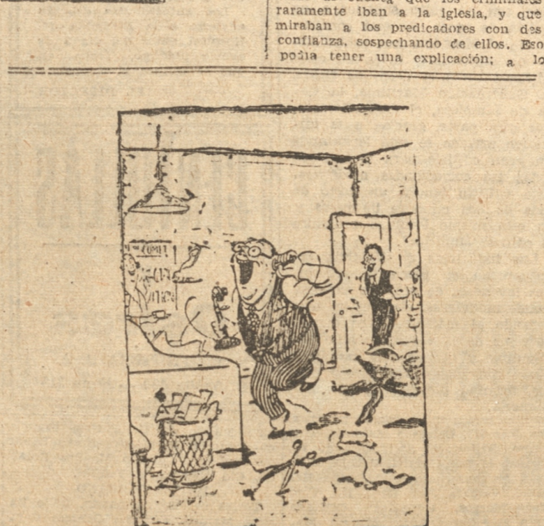
La alegría con que recibe el director de un gran diario la noticia de un crimen horrendo, con dos ancianos descuartizados y un niño quemado vivo.