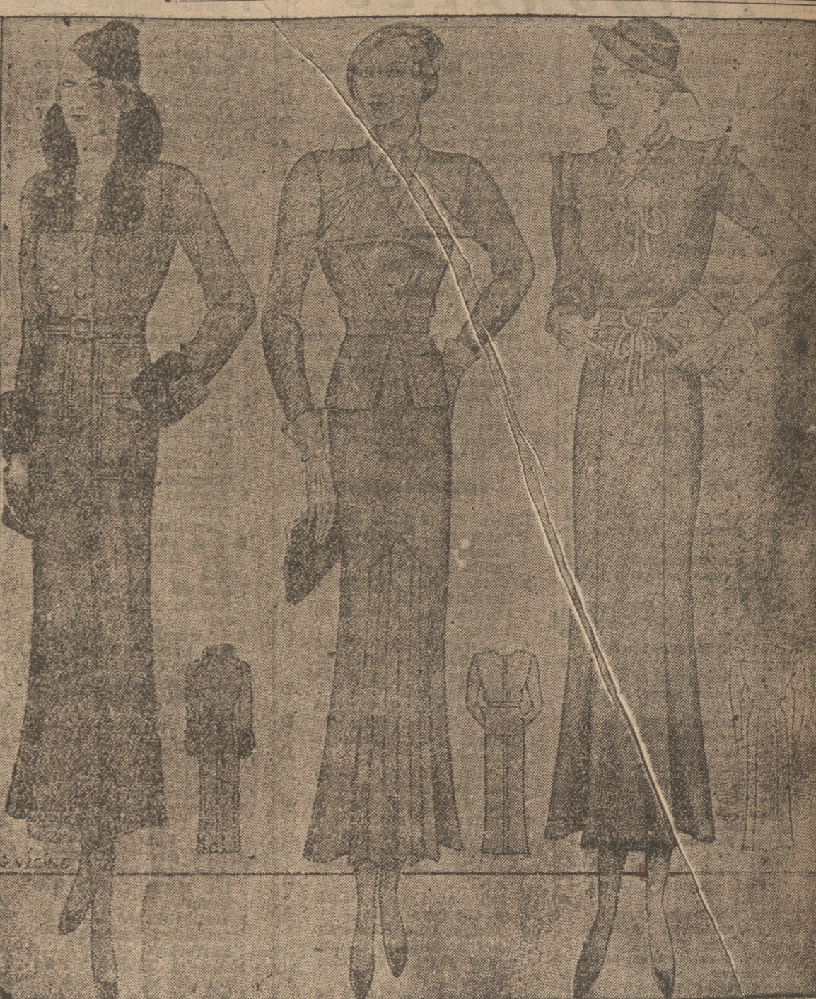
Abrijo muy elegante en lana verde botella, adornado con loutre. Recortes paspunteados, mangas raglan. Cuatro bolsillos y cinturón del mismo tejido con hebilla de acero y los botones haciendo juego.

El Gobierno no ve en la Milicia Republicana ningún peligro y, por el contrario, ve en ella una base de seguridad institución; autoriza su existencia y le presta su amparo.