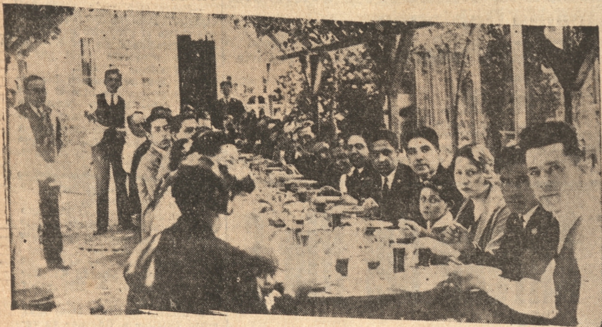
ASISTENTES AL ALMUERZO QUE EFECTUARON LOS SUB-OFICIALES DE LA ESCUELA DE TORPEDOS DE TALCAHUANO