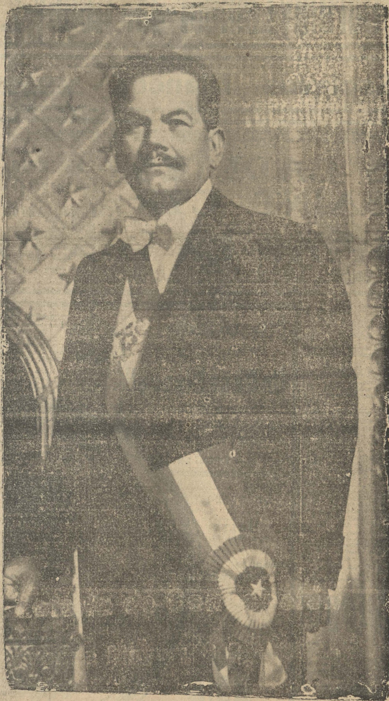
EXCMO. SEÑOR PRESIDENTE DE LA REPUBLICA DON PEDRO AGUIRRE CERDA, QUE AYER DECLARÓ IANUGURADO EL PERIODO ORDINARIO DE SESIONES DEL CONGRESO NACIONAL, CON LA LECTURA DEL MENSAJE QUE PUBLICAMOS

El Frente Popular no es la manifestación de las aspiraciones de intereses egoístas de algún grupo determinado de la sociedad chilena. Es la expresión democrática de la soberanía nacional surgida de las urnas, el lazo de unión de todas las fuerzas populares que contribuyen al engrandecimiento del país, las unas con su trabajo creador, las otras con su capital o con su inteligencia, y todas con su esfuerzo abnegado y entusiasta. Sus aspiraciones se refunden en principios patrióticos, honestos, noblemente inspirados: desea una democracia práctica, que ponga a toda la ciudadanía en condiciones de ejercer sus derechos sin distinción de clases sociales; ni fortuna, y con el más amplio res-