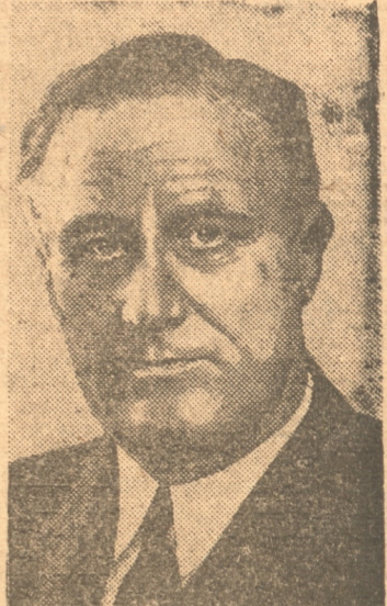
EL PRESIDENTE ROOSEVELT que en su anhelo de que la paz no desapareciera hizo llamados a la mayor parte de los gobiernos del mundo

WASHINGTON 29.—(UP).— Roosevelt pidió a la nación que uniera a él en las plegarias del domingo para la preservación de la paz mundial. Informaciones incompletas que llegan de las capitales extranjeras indican que el Presidente ha hecho esfuerzos para preservar la paz mucho más vastos de lo que se creyó al principio. Algunos diplomáticos extranjeros se adelantaron a opinar que el Presidente se puso en contacto con la mayor parte de los 63 gobiernos del mundo, si es que no lo hizo con el total de ellos, en un esfuerzo para movilizar una presión moral sobre las dos naciones al borde de la guerra. Hasta el momento tan solo el primer mensaje conjunto de Roosevelt a Hitler y Benes y su segundo llamado a Hitler fueron dados a la publicidad. En fuentes autorizadas se dice que Roosevelt instó al Duce a ejercer presión sobre Hitler para que este convocara a una conferencia y postergara la movilización. Se entiende que Roosevelt incluyó en su nota a Roma varias sugerencias.