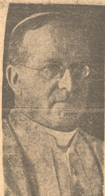
PIO XI, el Pontífice de la Iglesia Católica, se dirigió ayer al mundo y pidió oraciones por la paz amenazada.

CASTEL GANDOLFO, 29.—(UP).— Su Santidad el Papa empezó la invocación a la paz a las 7.32 P. M. usando el micrófono en su escritorio, en la biblioteca. CASTEL GANDOLFO, (UP).— Su Santidad, oró por la feliz conclusión de las negociaciones en Munich. Dijo: Mientras la humanidad se debate en medio de lágrimas ante el temor de una guerra, nosotros aquí elevamos nuestras preces por la paz. Ofrecemos de todo corazón nuestras oraciones por la paz y por el bienestar del mundo. Rogamos a Dios que las negociaciones tengan un término feliz. Rogamos a Dios que nos dé vida para ver el restablecimiento de la buena voluntad en el mundo.