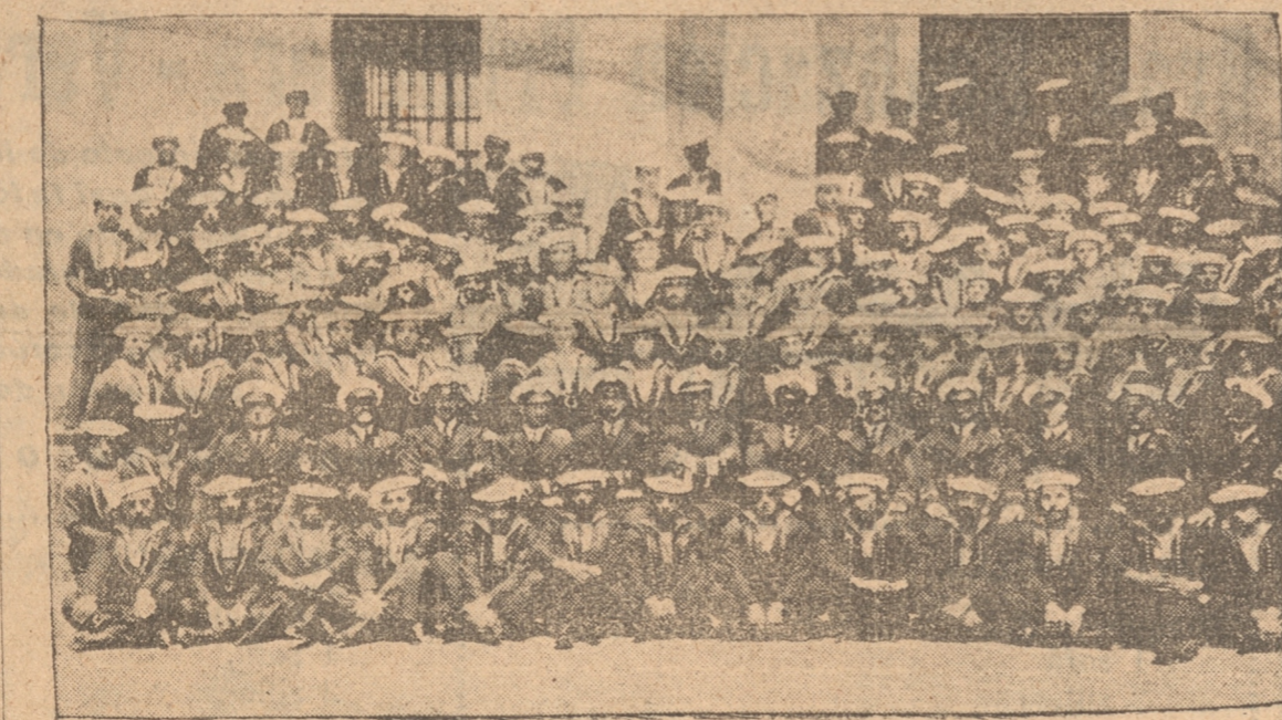
Grupo general de jefes y oficiales, instructores y alumnos de la Escuela