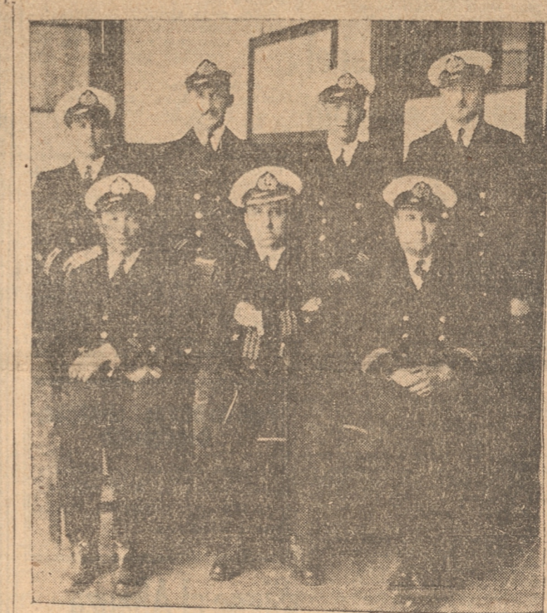
Director de la Escuela y oficialidad actual del mismo establecimiento.

Un curso de Artilleros para Tenientistas.