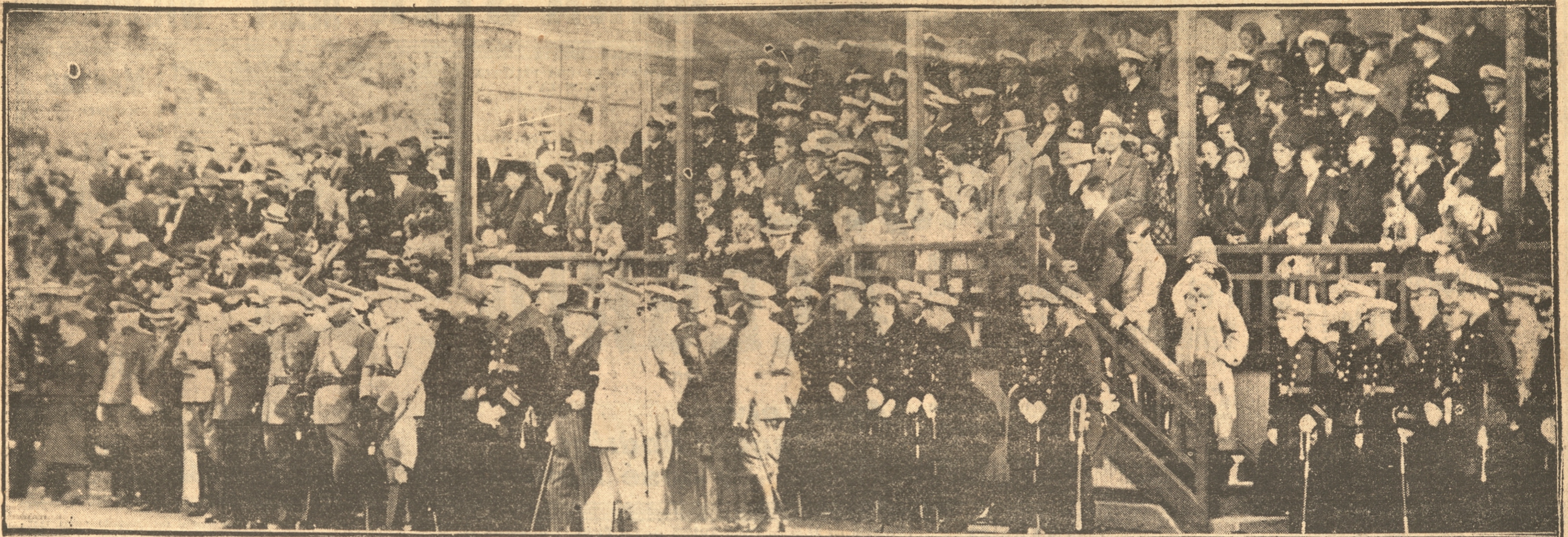
UN ASPECTO DE LAS TRIBUNAS DEL ESTADIO DURANTE LA CEREMONIA DE LA JURA DE LA BANDERA — AL CENTRO APARECEN LAS AUTORIDADES QUE PRESIDIERON EL ACTO —

El recuerdo de los héroes de Iquique congregó multitudes fervientes de patriótico entusiasmo