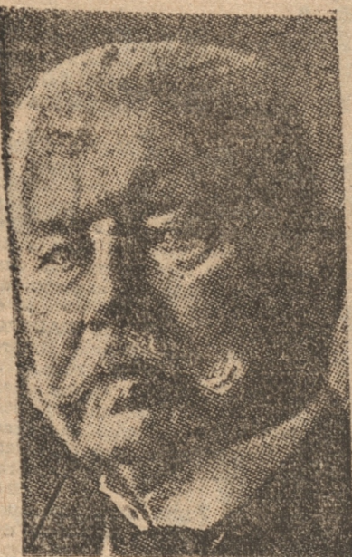
El Presidente del Reich, Mariscal Paul R. von Hindenburg

MAS DE 800 ALEMANES VIVEN ENTRE NOSOTROS. — LAS DIVERSAS INSTITUCIONES DE LA COLONIA SE DISTINGUEN POR SU ORGANIZACION. — EL LICEO ALEMAN, PRESTIGIOSO PLANTEL EDUCACIONAL.