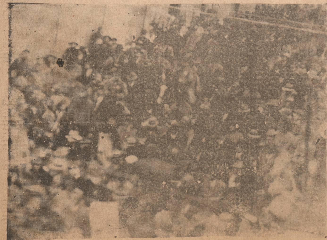
UNA ENORME MUCHEDUMBRE LO ACOMPAÑO Y LO VIVO ENTUSIASTAMENTE A SU LLEGADA A ANGOL