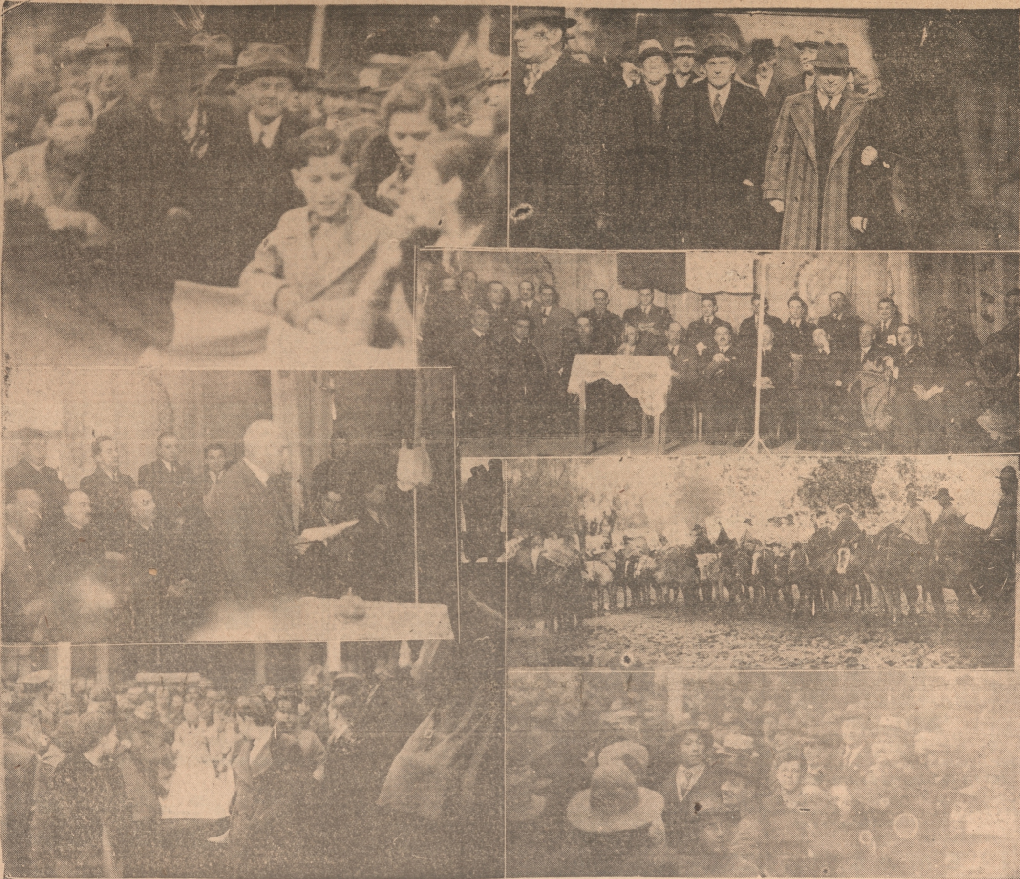
INSTANTANEAS DE LOS DIVERSOS ACTOS EFECTUADOS AYER EN ANGOL CON MOTIVO DE LA LLEGADA DEL CANDIDATO NACIONAL DON GUSTAVO ROSS SANTA MARÍA. EN ESA CIUDAD FUE ACLAMADO POR ELEMENTOS DE DIVERSOS SECTORES SOCIALES