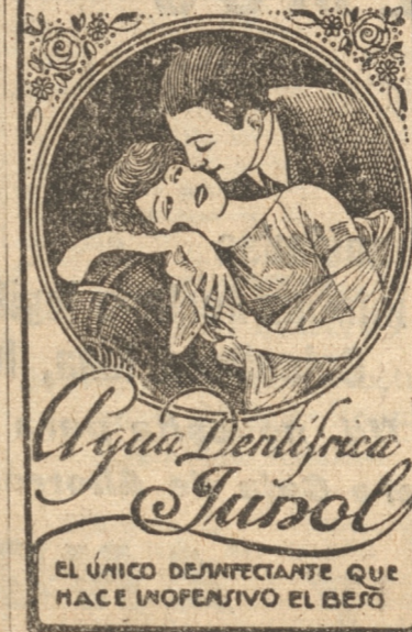
EL ÚNICO DENTÍFRICO QUE HACE INOPERATIVO EL BEO