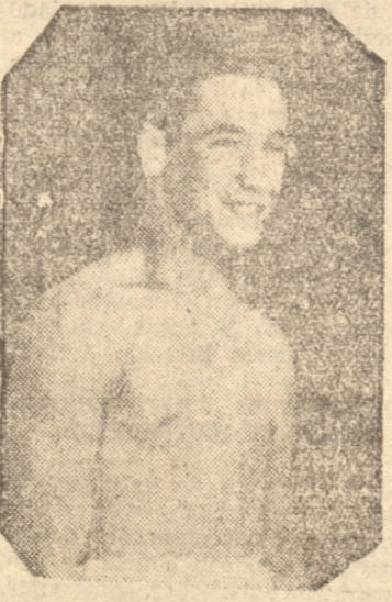
Fernandito fue "el crack"