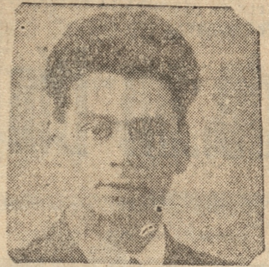
KERNEUR, del Cochrane

Esta tarde a las 15 horas. Por las condiciones del piso de la cancha no se hizo preliminar. LA HOJA El match será a las 15 horas. Por las condiciones del piso de la cancha no se hizo preliminar.