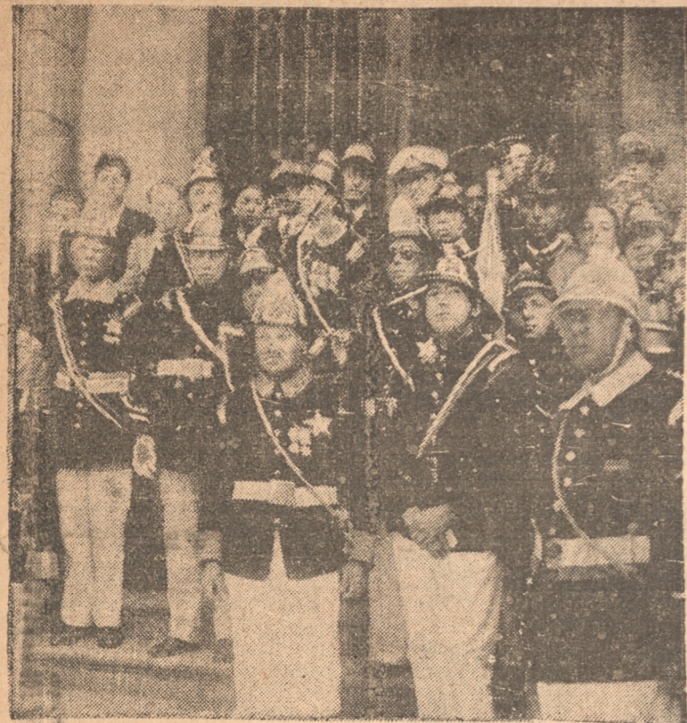
AUTORIDADES Y DIRIGENTES CON LOS EJERCICIOS. EL GALLO DE LA V COMPANIA QUE FUE BAUTIZADO AYER

Encierra este acto una elocuente lección para los que empiezan la dura tarea del bombero que, por desinteresada que sea, reciben el premio a que se han hecho acreedores en el cumplimiento de un deber, que voluntariamente se han