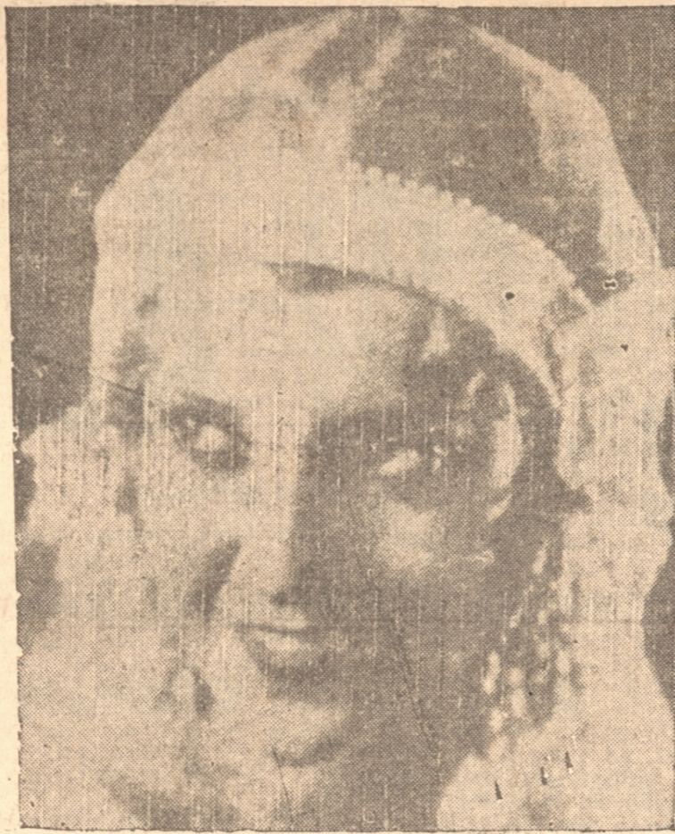
KAT, EL DE "SIN NOVEDAD EN EL FRENTE"