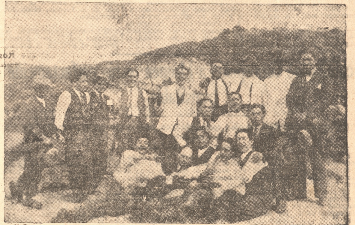
Un grupo de los asistentes al paseo de ayer en Ramuntcho

Lo hizo todo el personal del Club Concepción.— Regresaron a las 18.30 horas