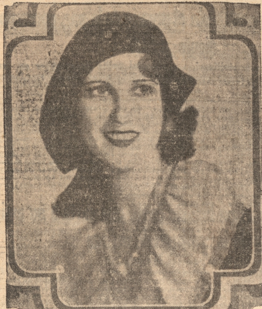
JEANETTE MAC DONALD La maravillosa mujer y divina cantante