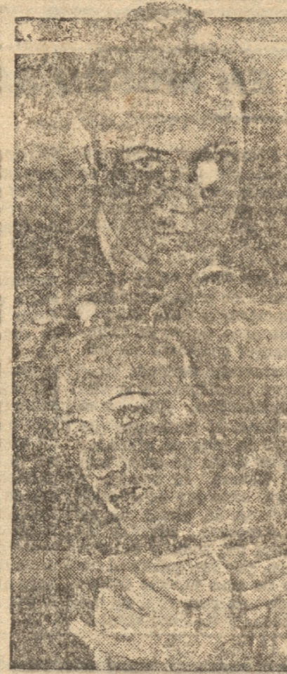
GRETA GARBO and ROBERT MONTGOMERY in "INSPIRATION"

Una vez más brillará como la primera y única