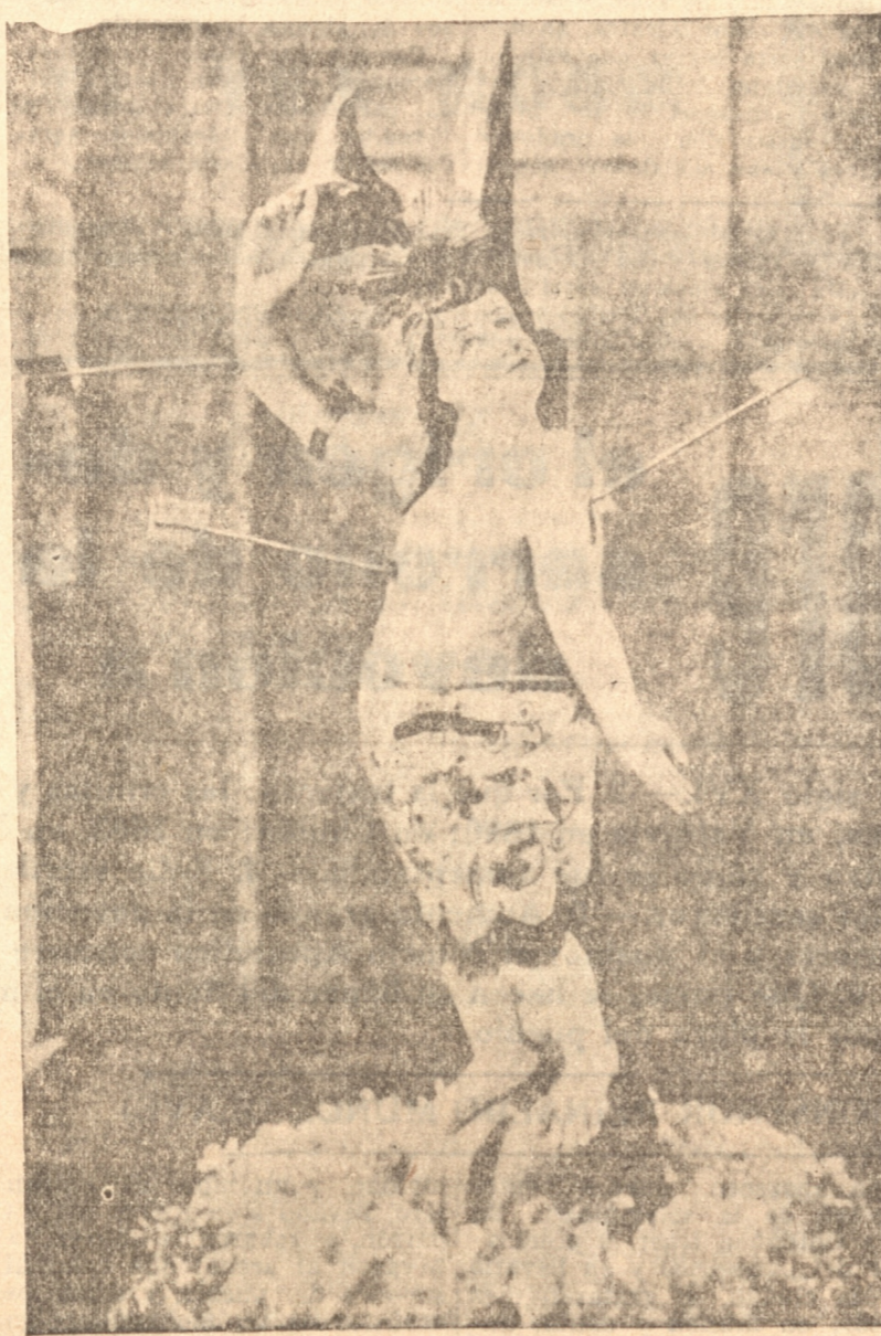
LA IMAGEN DEL SANTO

vo a un espléndido remate. Desde que llegó en 1902, y con venido de la trascendencia de la obra, se propuso llevar la adelante a medida que lo fueran permitiendo las circunstancias. Año por año fué aumentando el número de grandes salas o galpones, hasta llegar a cerrar con ellos la manzana parroquial en la mitad de su extensión. Agregó a esas construcciones, que daban a tres calles, con un largo de 141 metros, otros galpones en el interior con un largo de 103 metros, y todas las construcciones con un ancho medio de doce metros. Dotó la hospedería de lo más necesario para la posible comodidad de los peregrinos y la facilidad para el servicio: compró servicio de mesa, banos, etc., para los comedores, y para los dormitorios compró algún modesto menaje con el cual pudieran descansar durante la noche varios miles de personas con aseo y seguridad.