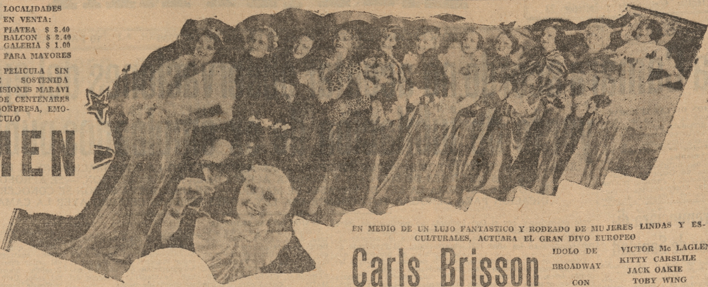
EN MEDIO DE UN LUJO FANTASTICO Y RODEADO DE MUJERES LINDAS Y ESCULTURALES, ACTUARA EL GRAN DIVO EUROPEO