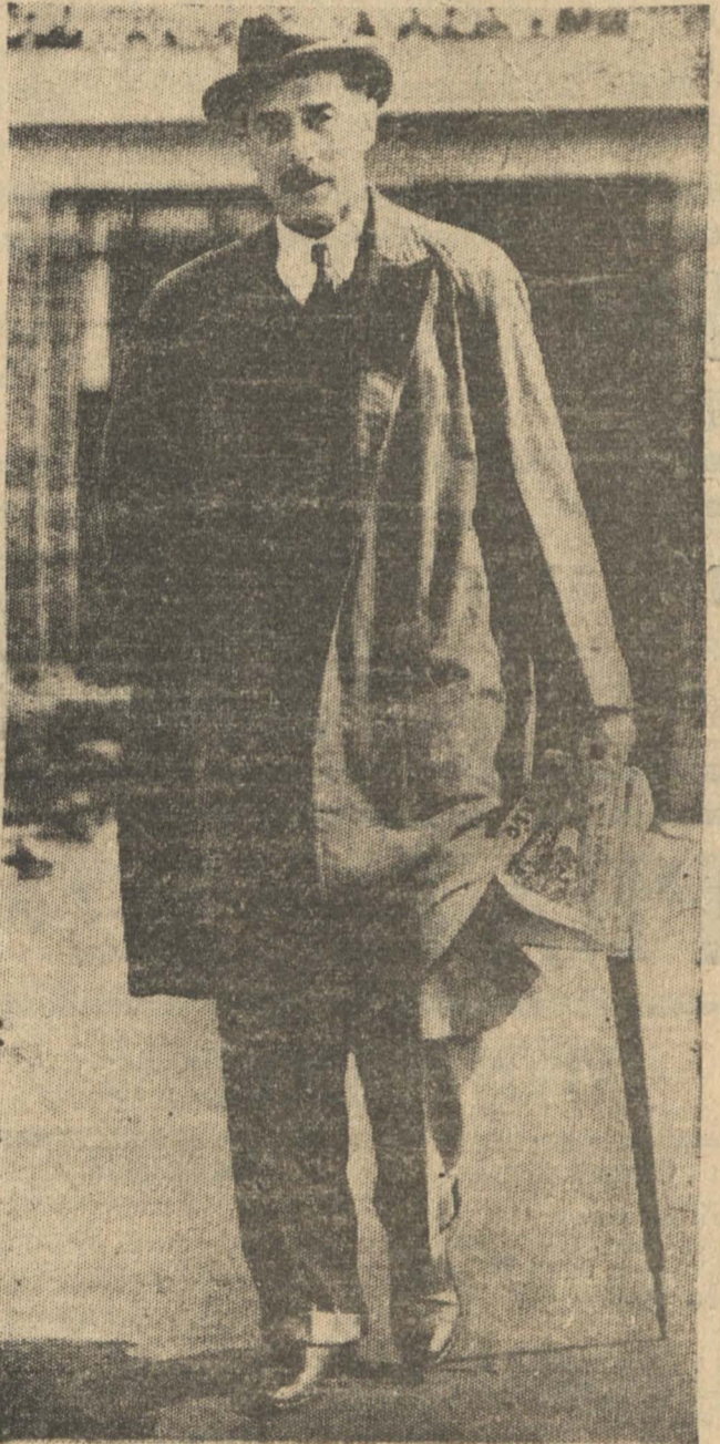
HENDERSON, el ex-Embajador de Gran Bretaña en Berlín, se retira después de celebrar una entrevista con Chamberlain.

El nuevo cargo ofrecido a Churchill es considerado por la mayoría de los observadores italianos como una indicación de que Gran Bretaña proseguirá la guerra con más energía. A este respecto en la mayoría de los círculos italianos se considera a Churchill como una persona poco comprensiva de las aspiraciones de Italia, lo que hace presumir que el mejoramiento de las relaciones anglo-italianas pueda por tanto sufrir contratiempo.