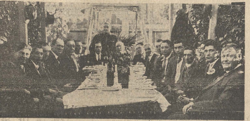
Miembros del Sindicato Profesional de Trabajadores y personal de Remolcadores de la Bahía, asistentes a la manifestación