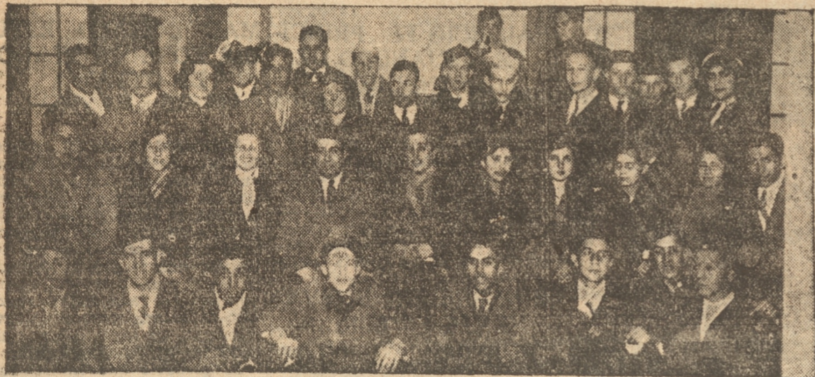
LOS ALUMNOS DEL INSTITUTO SUPERIOR DE COMERCIO EN SU VISITA A NUESTRO DIARIO

En el día de ayer estuvieron en Talcahuano.— Hoy se dirijirán a Penco y mañana a Lota.— El domingo seguirán su viaje al sur