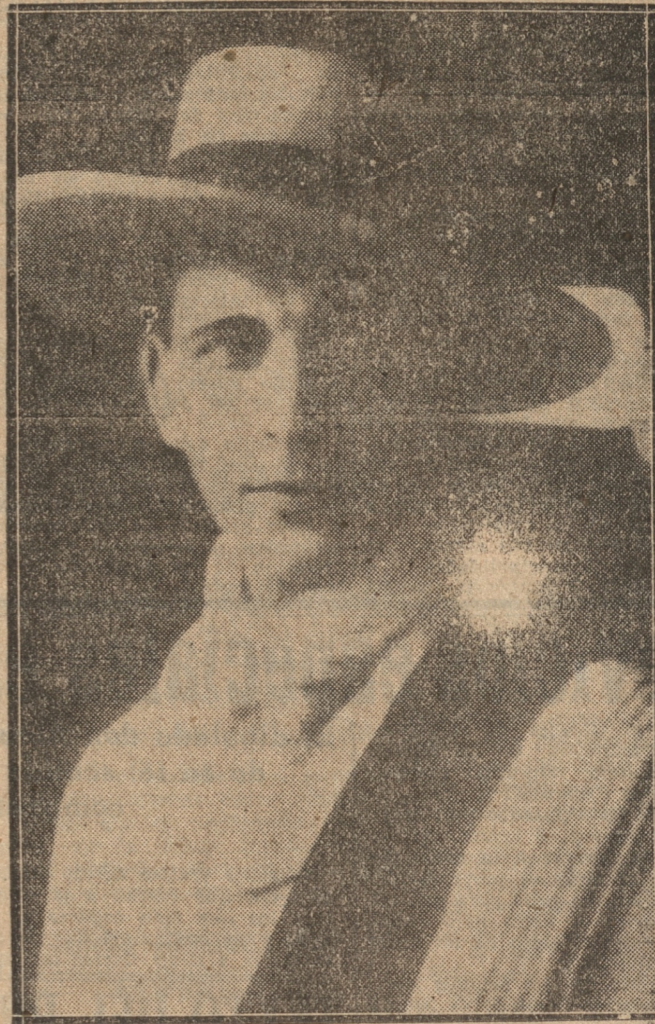
ALEJANDRO FLORES, primer actor de la escena nacional, en cuyo honor es la función de esta noche en el teatro Concepción.

Toca hoy a su término la brillante, y para nuestra ciudad muy larga, temporada de la compañía que encabeza y dirige Alejandro Flores; con la última función se rendirá también homenaje al primer actor, que lo es no sólo del conjunto a que da su nombre sino de la escena nacional.