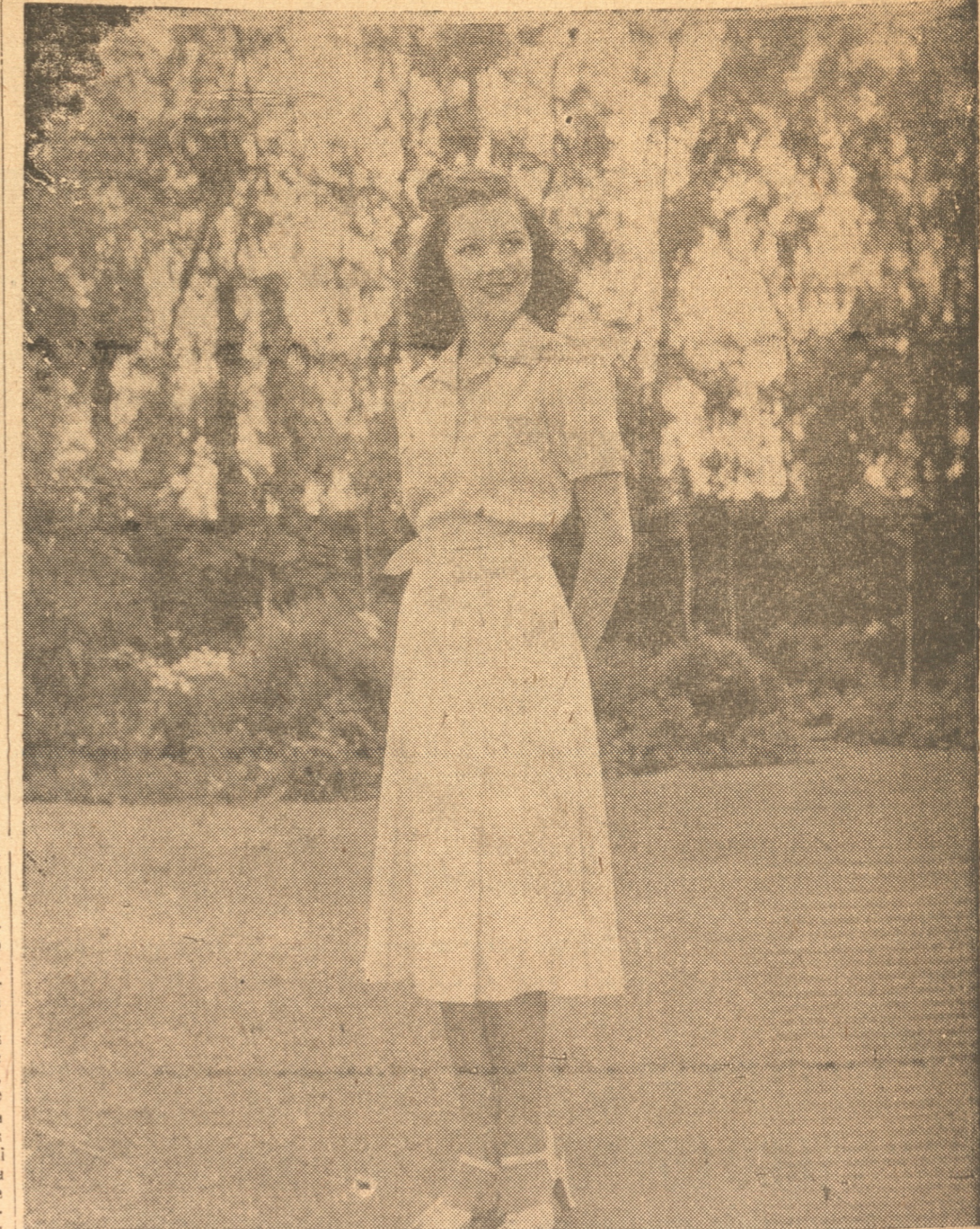
Esta agraciada morena es Ann Rutherford, actriz de la Metro-Goldwyn-Mayer, ataviada con un sencillo traje de color rosa