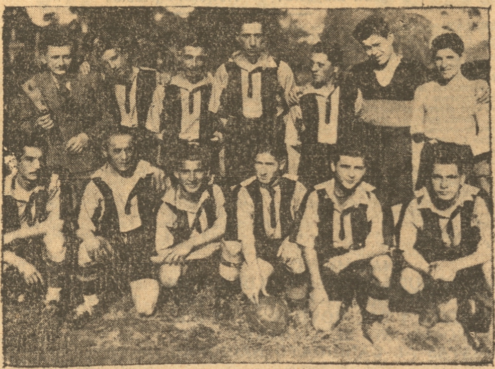
LOS DEFENSORES DEL CUADRO VIALINO.

El clásico local de este año — y desde hace tiempo ya — lo jugarán los teams de Fernández Vial y del Lord Cochrane. Si el clásico de nuestro fútbol pues el que se juega en la tarde de hoy en la cancha Colloa. Juegan por el regional y por el certamen local. De ahí el mayor interés de esta brega que llevará publicado, sin duda alguna a la cancha Colloa. El match se presenta de interés. Si bien Lord por sus últimos lances lleva más chance que los aurinegros no se debe desconocer que el cuadro vialino debe agrandarse ante su adversario dada la rivalidad que tiene cada team. El año 1936 fué Lord el que llegó a la cancha así en forma. Y sin embargo se mandaron un partidazo que debió ganar el Cochrane y que terminó en empate cuando todos creían en fácil victoria del Vial. Este año puede suceder lo contrario. A la cancha del Lord como seguro ganador se puede ver como Vial se puede agrandar y hacerle a los verdes una sonada lucha. Con ello ganará el público y veremos un partido guapo; bonito. Ya sabemos que la gente del Vial no entrega así no más las herramientas.