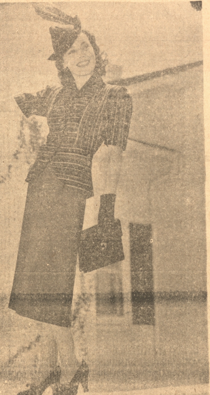
Maureen O'Sullivan actriz de la Metro-Goldwyn-Mayer, luce aquí un elegante y atractivo vestido propio para la estación

la carga intolerable de la miseria de los demás".