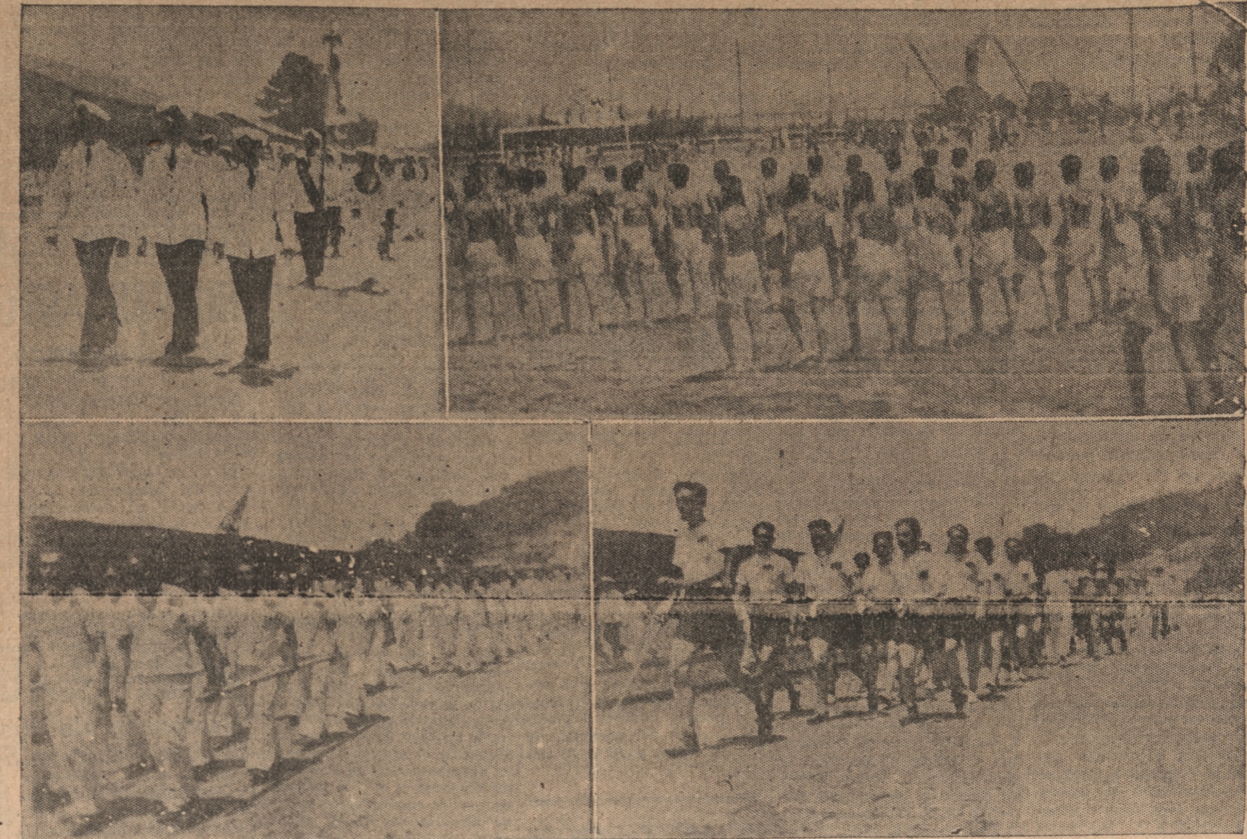
En primer término, la marinería desfilando.— A continuación los atletas durante los ejercicios.— Abajo los gimnastas que actuaron brillantemente y los futbolistas.

Dr. Weitzman AUSENTE HASTA EL 8 DE ENERO DE 1940.