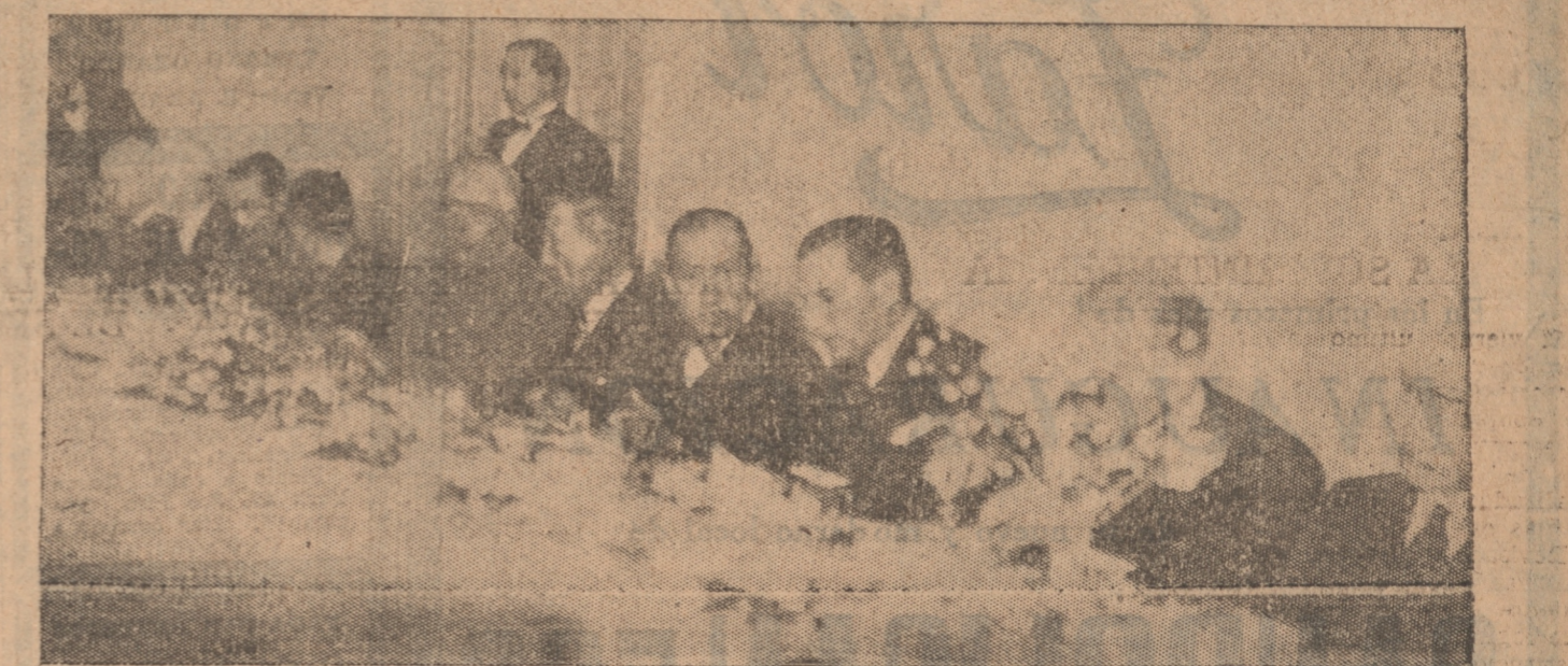
Mesa de honor del banquete de la noche en Club Concepción