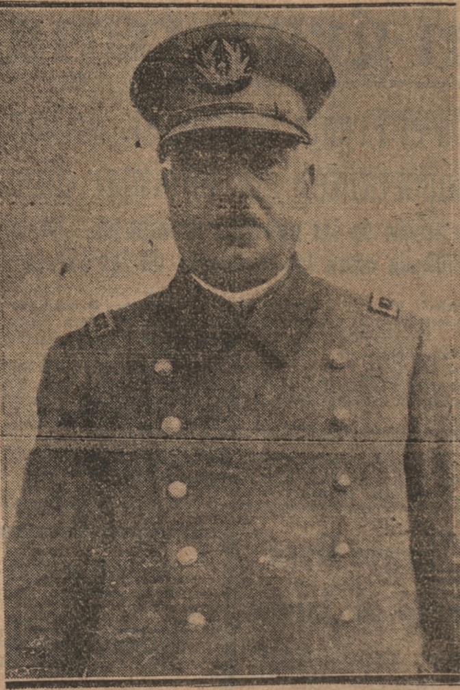
General don Victor Cañas Ruiz Tagle.

Si hasta ahora no se ha caminado más rápidamente por las vías de adelanto que todos quisiéramos ver, se ha debido a que durante largos años la iniciativa privada sola ha luchado por levantar a esta ciudad, sin que hubiere la concurrencia del Estado no sólo en el sentido de hacer obras nuevas, pues ni siquiera en el de reparar las antiguas y resolver los problemas más palpitantes. Recordemos la historia larga de las gestiones para construir el Hospital Clínico Regional; para el edificio de Correos y Telégrafos; para los edificios de los Liceos de Hombres y de Mujeres; para escuelas públicas; para caminos, entre ellos el de Concepción, Penco y Tomé; para Hogar de Menores; para Estación Central de los Ferrocarriles; de las obras de mejoramiento del servicio de agua potable; de los alcantarillados y tantas otras necesidades insatisfechas, que en más de una ocasión hicieron exclamar al actual vicepresidente de la Corporación de Reconstrucción y Auxilios, entonces miembro distinguido de las organizaciones fundadas para trabajar por el progreso local regional que "el gobierno no está en mora en Concepción por todo lo que no hizo en el curso de decenas de