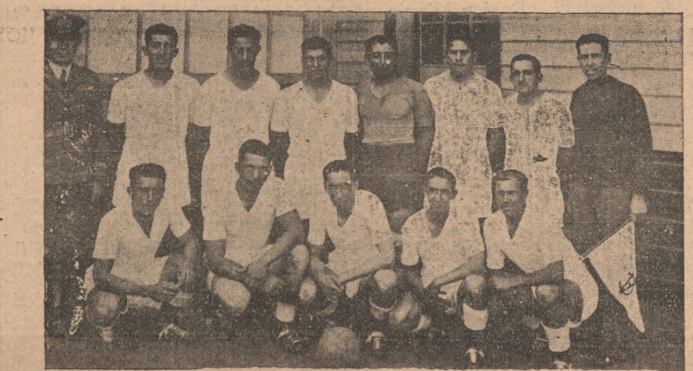
Equipo vencedor en la competencia de fútbol del Apostadero Naval