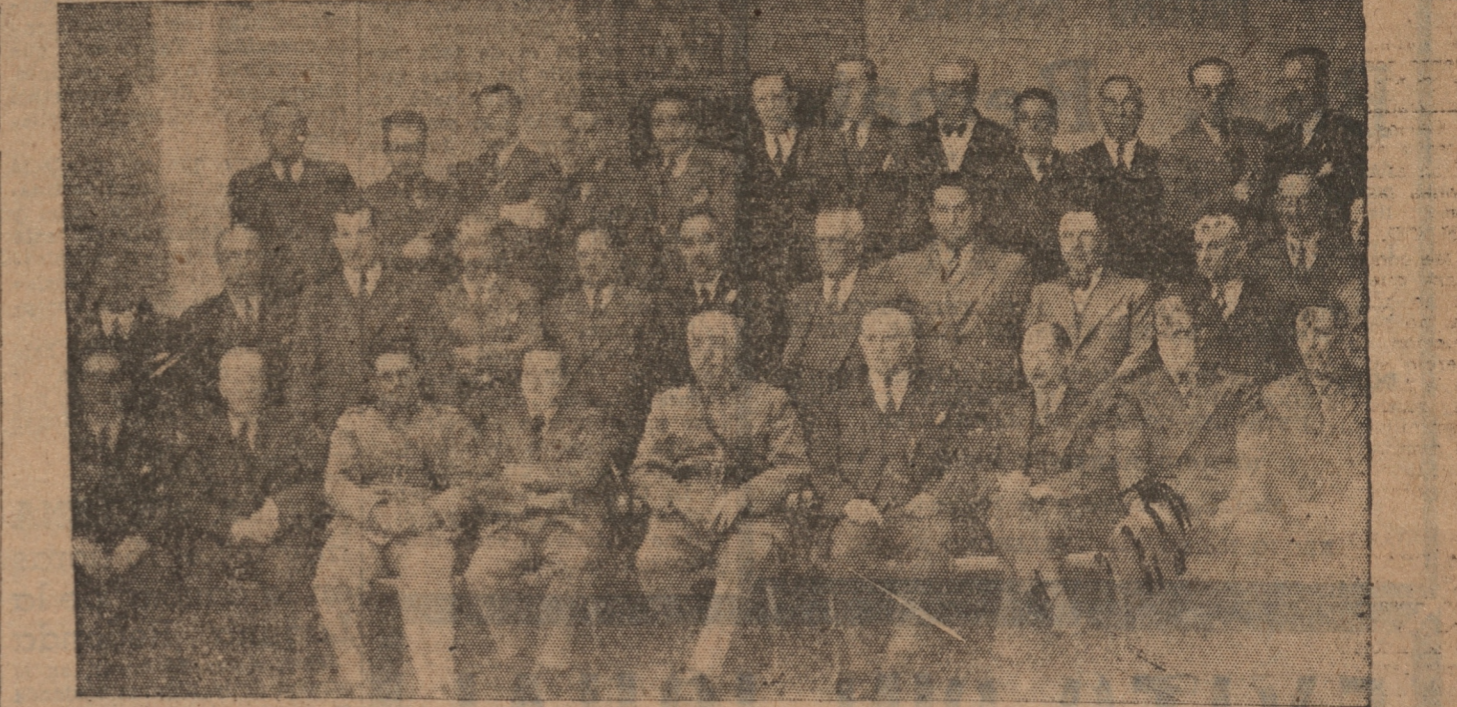
Mesa de honor del banquete de la noche en el Club Concepción.