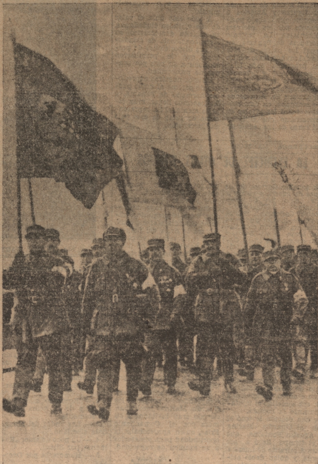
Tropas finlandesas, durante un desfile por las calles de Helsinki, antes que estallara el actual conflicto

El general Walleinus, comandante en jefe del frente norte, declaró: "Mis muchachos han superado el máximo de lo que los crea capaces. Sabía que eran buenos soldados, pero jamás imaginé que fuesen tan buenos como lo han demostrado estos últimos días". Indicó que las perspectivas finlandesas aparecían oscuras en esa región al comienzo de la guerra. Hacía mucho tiempo que los rusos habían preparado allí rutas estratégicas y es sabido por un oficial prisionero que las tropas rusas se hallaban allí concentradas desde el 8 de septiembre. Como ejemplo de la mala dirección, recordó como los oficiales rusos habían ordenado a todo un destacamento colocarse en lugar demasiado visible, siéndole posible a un grupo de guerrilleros finlandeses aniquilarlos en dos minutos.