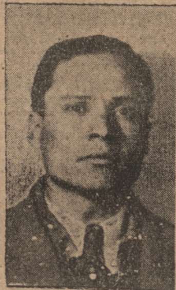
S. PARRA que puede hacer suya la sexta carrera con Jaranero

no y a su preparador le gusta una barbaridad; Estatuario, que llegó segundo de Polvo de Oro; Verascopio, que encontrará una pista más o menos apropiada a sus medios; Diómedes, que a estos se las ha dado en ocasiones anteriores; La Higuera, que se ha visto corredora y Gran Militar por lo livianito y puede venirse de un viaje.