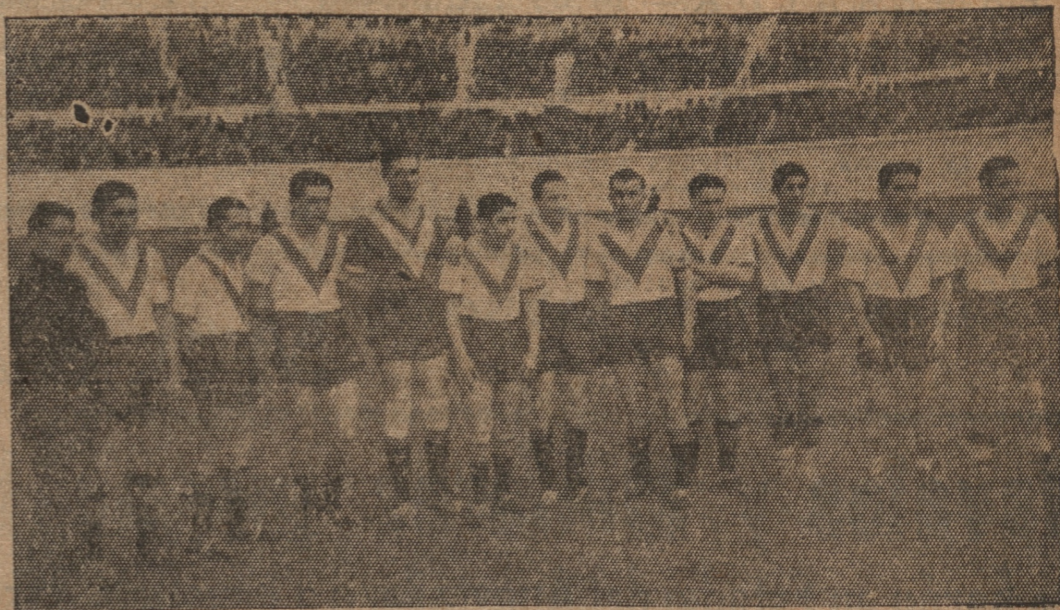
El cuadro de la Profesional que juega hoy contra River Plate en Santiago.