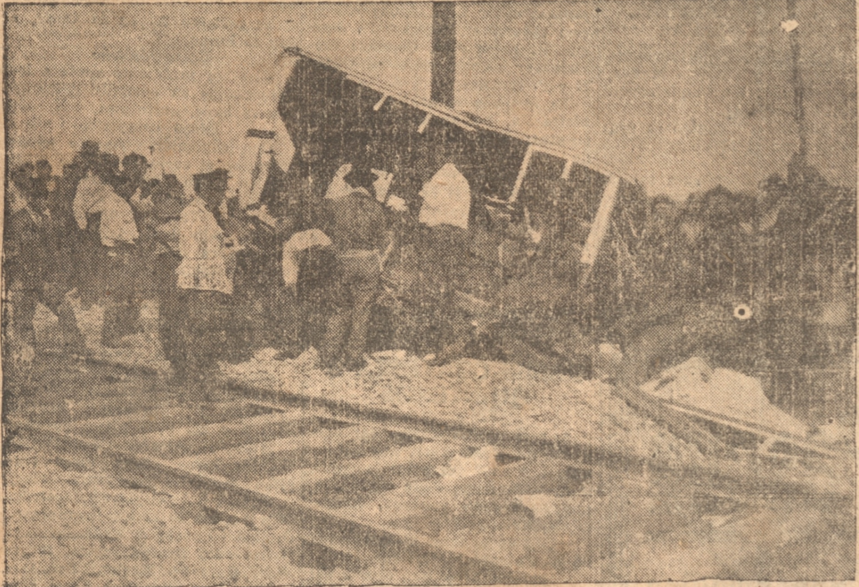
ESTADO EN QUE QUEDO LA GONDOILA DESPUES DEL CHOQUE

Ahora se impone la adopción de medidas preventivas para evitar que en el futuro se produzcan nuevos accidentes en ese lugar. Primero debería colocarse allí un guarda-cruzada permanente durante el día, a fin de que anuncie la proximidad de los trenes.