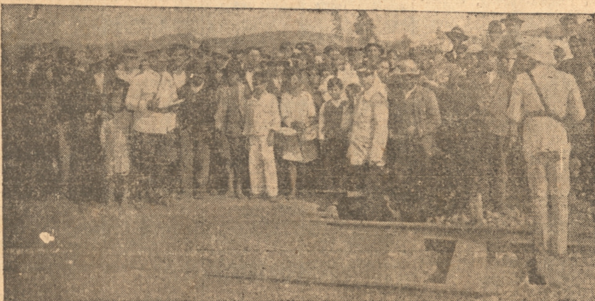
PUBLICO NUMERO SO LLEGO AL LUGAR DEL ACCIDENTE