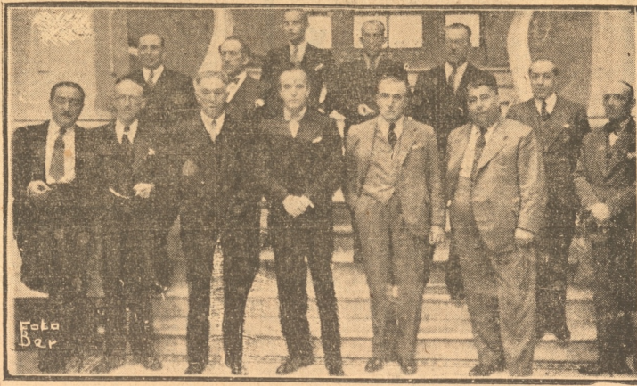
GRUPO DE ASISTENTES AL ALMUERZO EN EL CLUB CONCEPCION