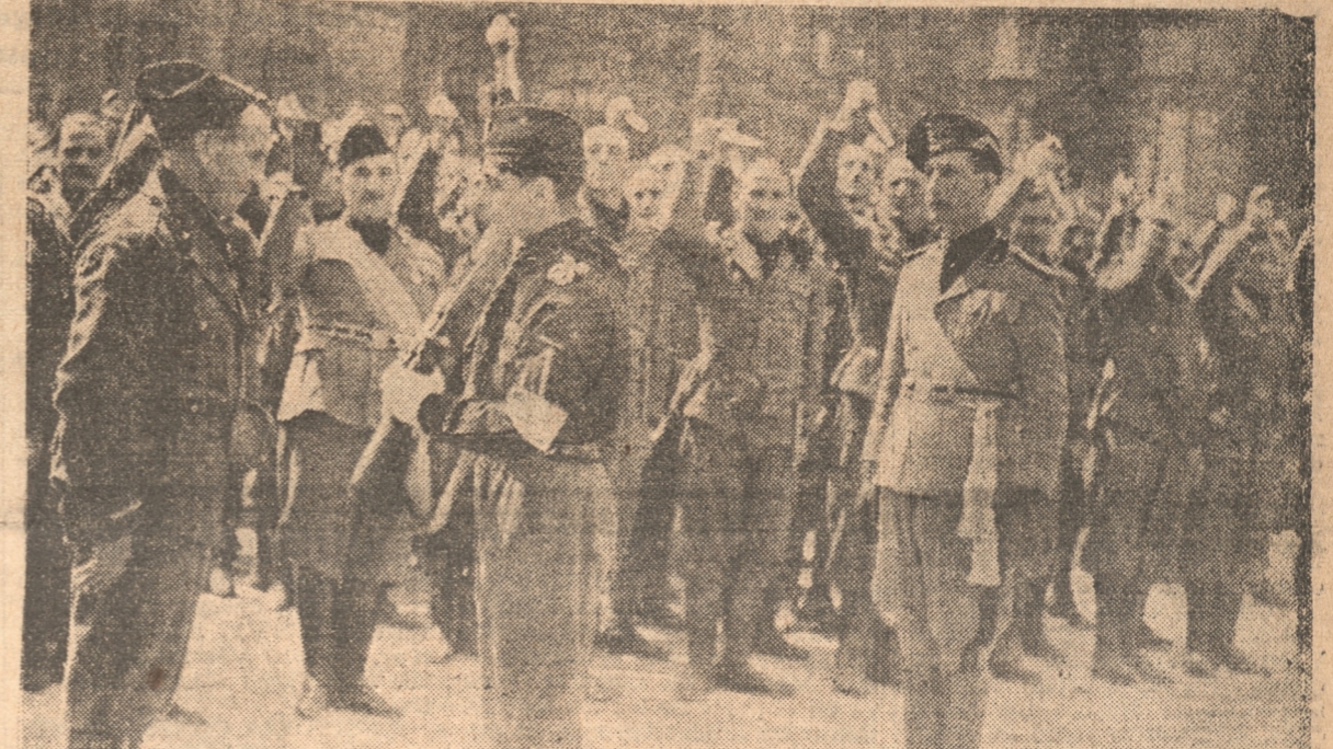
CONSAGRANDO MILICIANO S FASCISTAS, QUE PRONTO DEBEN PARTIR AL AFRICA