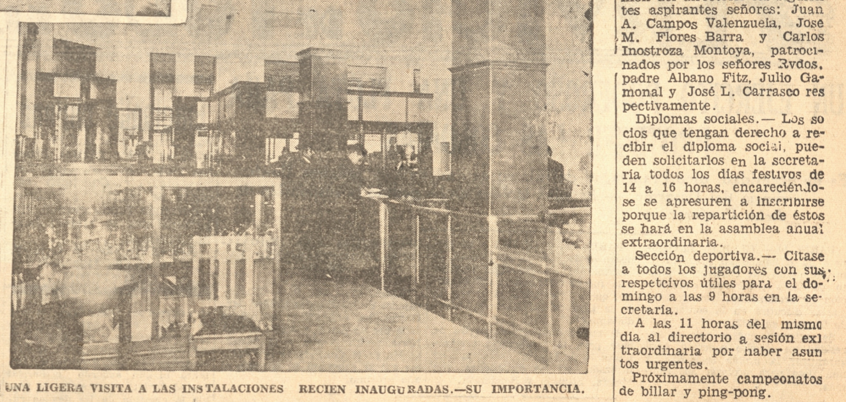
UNA LIGERA VISITA A LAS INSTALACIONES RECIEN INAUGURADAS.—SU IMPORTANCIA.

A las 11 horas del mismo día al directorio a sesión extraordinaria por haber asuntos urgentes. Próximamente campeonatos de billar y ping-pong.