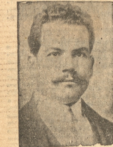
Don Pedro Aguirre Cerda, cuyo nombre se baraja para Ministro de Educación.