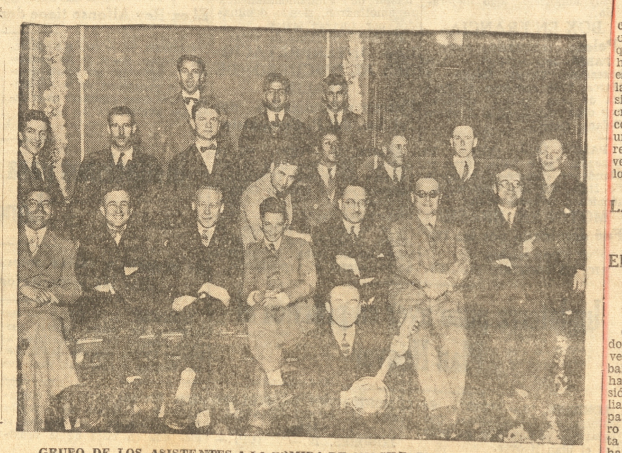
GRUPO DE LOS ASISTENTES A LA COMIDA DE ANOCHE DE LOS "QUIMICOS"

A este acto concurrieron el profesorado de la Escuela de Química y numerosos invitados especialmente algunos miembros del directorio de la Universidad.