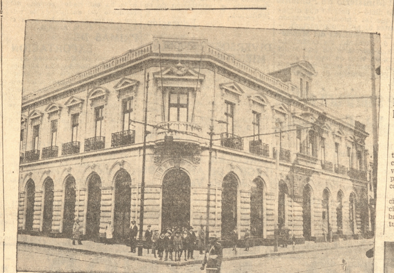
FACHADA Y VISTA DEL INTERIOR DE LA SUCURSAL DE LA DROGUERIA DEL PACIFICO

Ayer abrió sus puertas al público la sucursal de la Droguería del Pacífico en Concepción, en su nuevo local ubicado en calle Barros Arana esquina de Rengo.