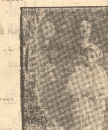
UN GRUPO DE SEÑORITAS QUE HICIERON DIVERSOS OBSEQUIOS A LA TROPA