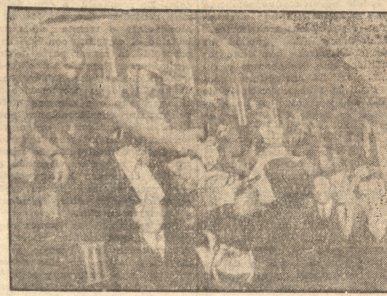
SIN DESCENDER DEL CONVOY LOS CONSCRIPTOS COGEN LOS OBSEQUIOS QUE LES OFRECEN LAS DAMAS

El coronel señor Benedito continúa al mando de todas las unidades que se encuentran en el vecino puerto, mientras el alto comando se encuentra en nuestra ciudad.