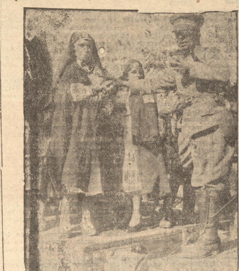
SOBRE LOS CARROS PLANOS DEL TREN, UNA DE LAS DAMAS OBSEQUIA FRUTAS A UN SOLDADO