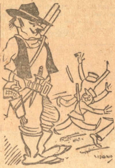
acción del gremio.

La policía tuvo que desplegar una gran actividad para impedir estos choques funerarios y fueron muchos los cadáveres de hombres notables y hasta ilustres que se dirigían al Cementerio completamente desamparados, debido a la