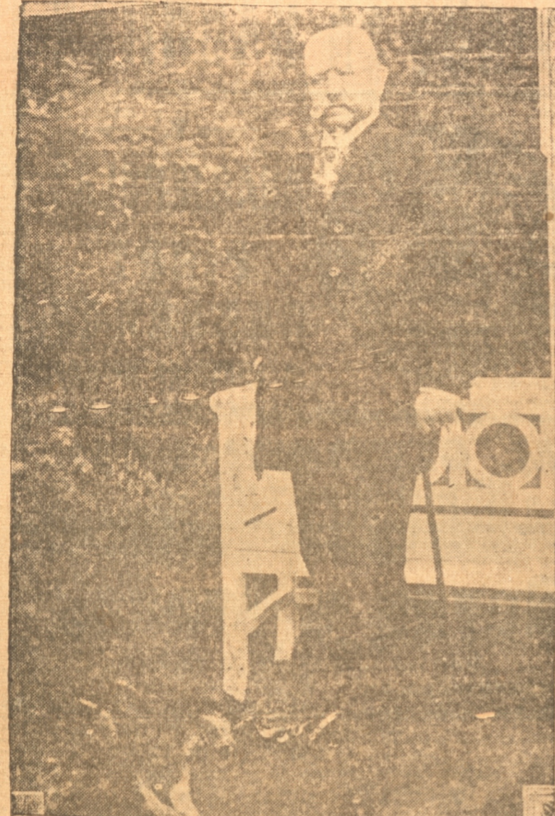
VON HINDENBURG QUE OBTUVO LA PRIMERA MAYORIA