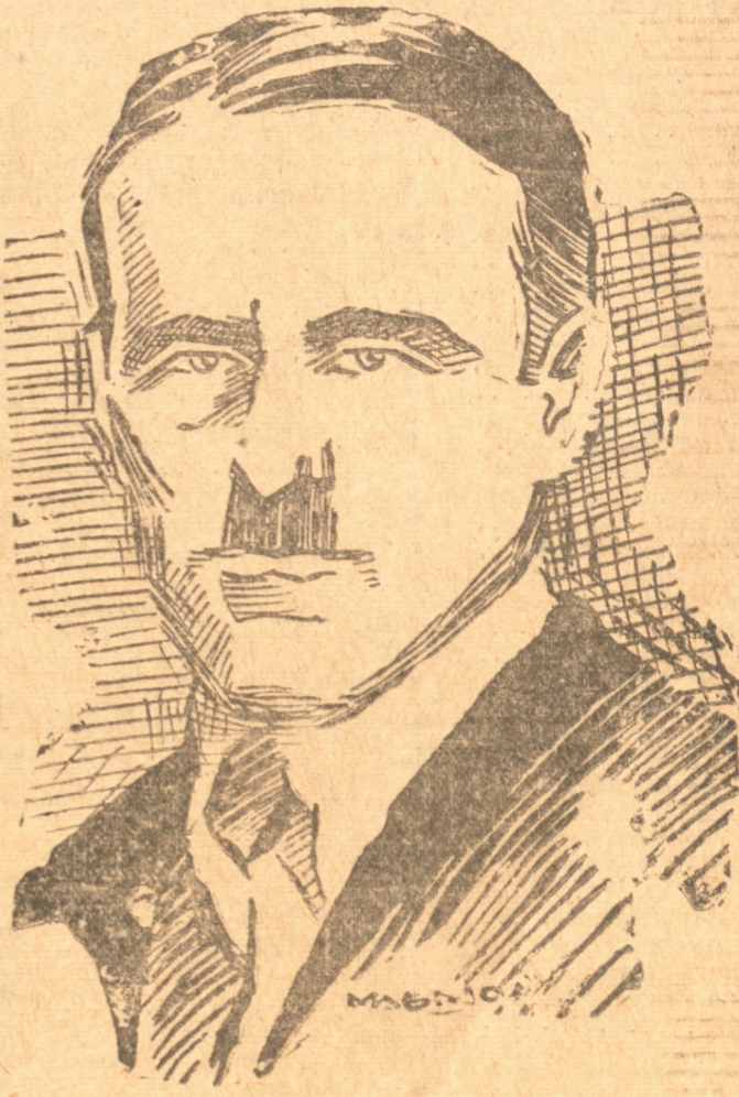
HERR HITLER, QUE OBTUVO LA SEGUNDA MAYORIA