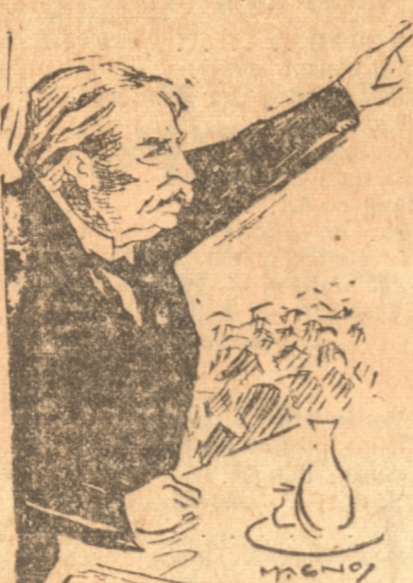
y el secretario de la "Unión de enterradores".

En los mismos momentos de la tierra, se presentaron a la oficina del Fiscal de Chicago, el presidente