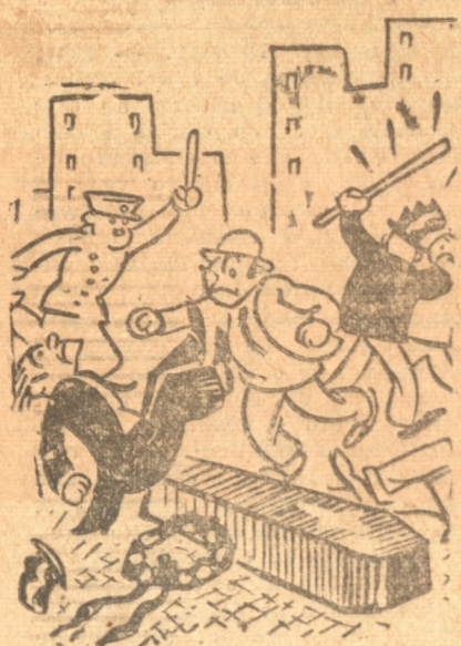
EL CORTEJO DE LOS ENTERRADORES

Los cortejos fúnebres verificados últimamente en Chicago se vieron repentinamente envueltos en choques violentos, promovidos por el gremio de enterradores. La causa no era otra, que la campaña emprendida por este gremio contra la "competencia" que los clientes y acompañantes de los cortejos hacían a los conductores profesionales de coches.