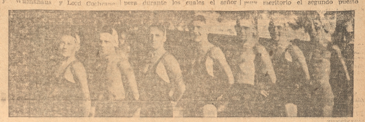
EL TEAM DE WATER POLO DEL GLENASTICO ALEMÁN, QUE AYER VENCIO EN GRAN FORMA A F. VIAL, ADJUDICANDOSE EL CAMPEONATO DE CONCEPCION Y UN PUNTO POR LA COPA DIRECCION DE "LA PATRIA"