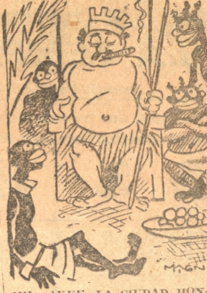
MILWAKEE, LA CIUDAD HONRADA

der su vida... Pero los enemigos de Briand trataban de molestarlo hasta en su camino al Cementerio, como lo hicieron durante toda su vida: el sábado, al atravesar el cortejo los Campos Eliseos algunos anti-briandistas quisieron cortar las filas... Quizás si ellos no oyeran esas palabras admirables pronunciadas por el Carenal Verdier al bendecir al cadáver: "En presencia de la muerte debe haber un universal respeto de parte de todos los hombres cristianos y de buena voluntad".