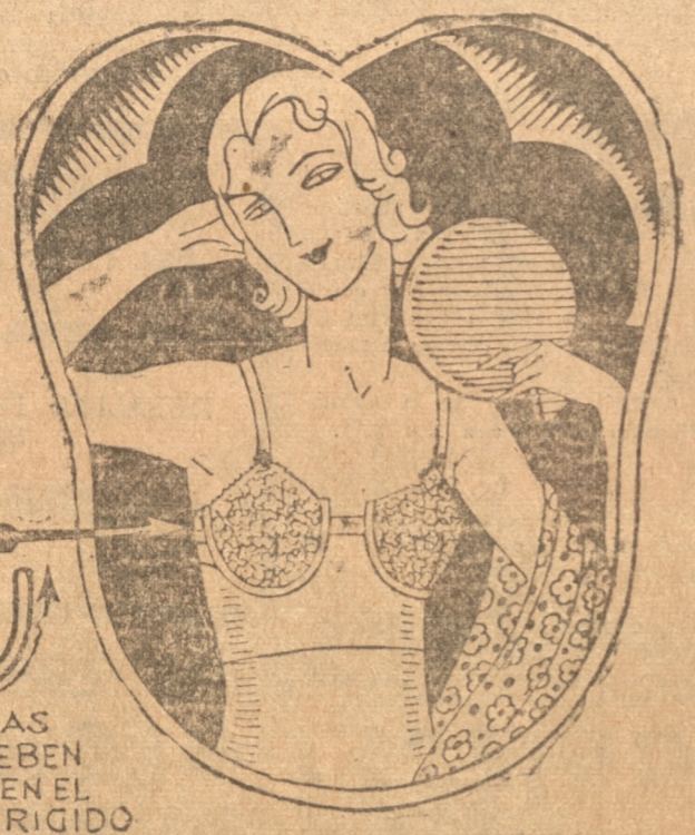
MEDIDAS QUE SE DEBEN TOMAR EN EL SOSTEN RIGIDO

El cuerpo se modela admirablemente y los senos adquieren delicada turgencia