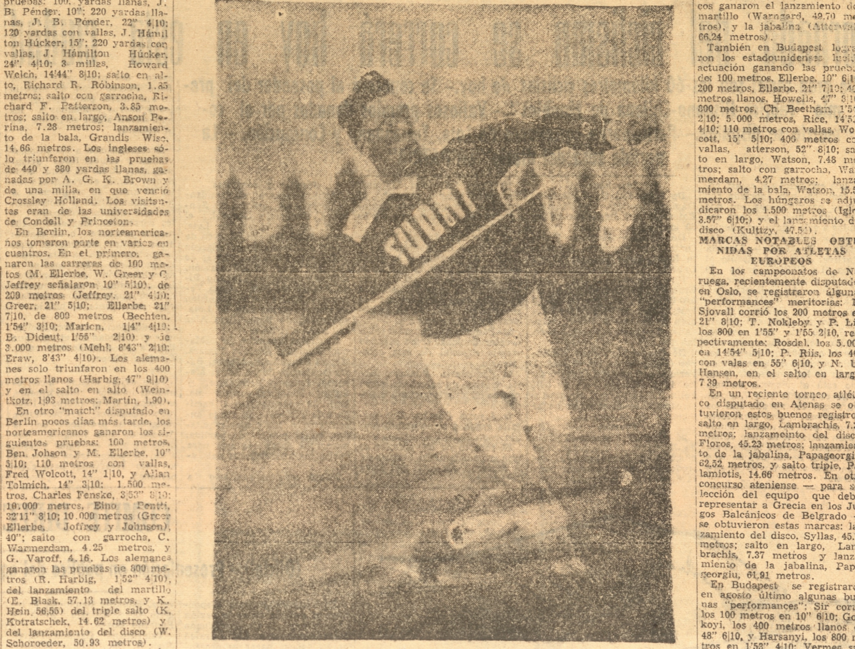
MATTI JARVINEN, el notable dardista de Finlandia que ha señalado notables marcas en torneos últimos efectuados en Europa

Publicamos una interesante reseña de ellas. - Los mejores torneos realizados en lo que va corrido del año. - Siempre los atletas yanquis con buenas performances. - Torneos en Europa dan buenos triunfos y marcas a atletas de Finlandia, Alemania, Suecia, Inglaterra y otros países. - Preparativos para la Olimpiada de Finlandia