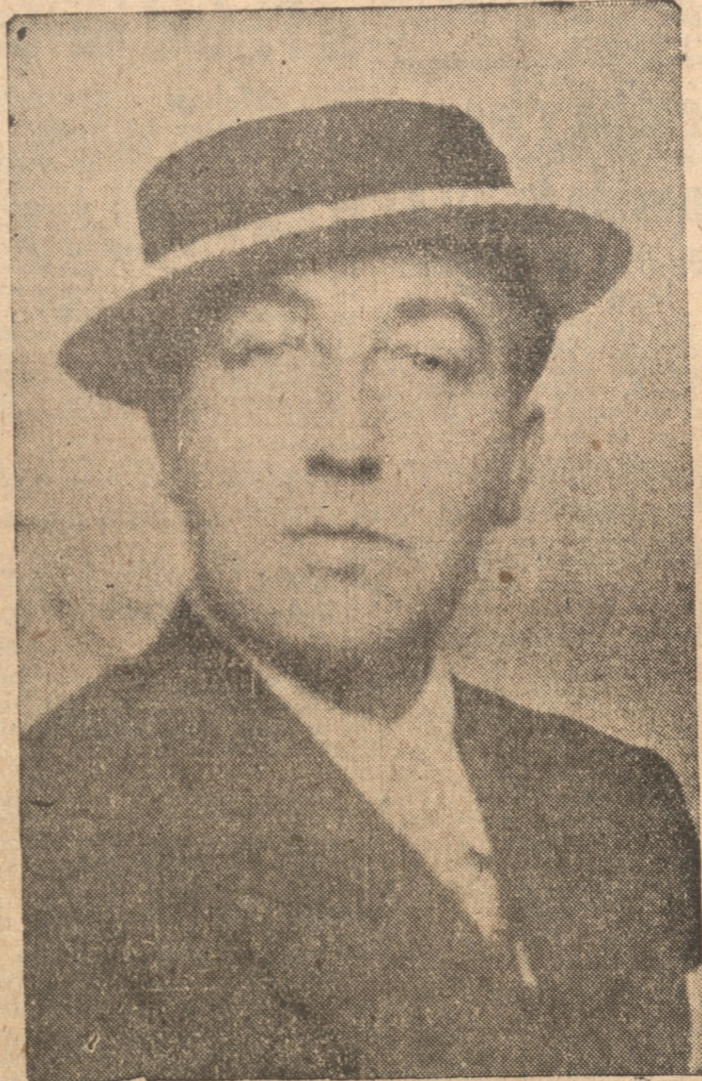
EMANUEL CALCAGNO, tenor chileno que conoceremos el martes

Se presentará en ese teatro el martes de la semana próxima