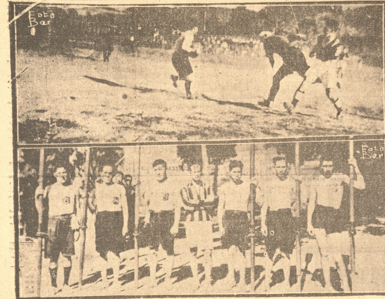
1. — Astete, meta del Lord en una buena actuación, frente al Torneros de Talcahuano. 2. — Equipo del Centro Concepción de la Unión Nacional que se clasificó primero, su serie en las regatas de ayer

Ya no tendremos competencia internacional hasta el término de la primera rueda oficial. El 11 de abril empezará el campeonato All-uvio con 10 mil pesos de premio al vencedor y en seguida el campeonato oficial en su segunda edición. Entrará la primera y segunda rueda habrá un receso de un mes, el que será aprovechado por los clubes para salir en jira al exterior o programar una competencia internacional. —(G. Arriaza R. correspondiente)