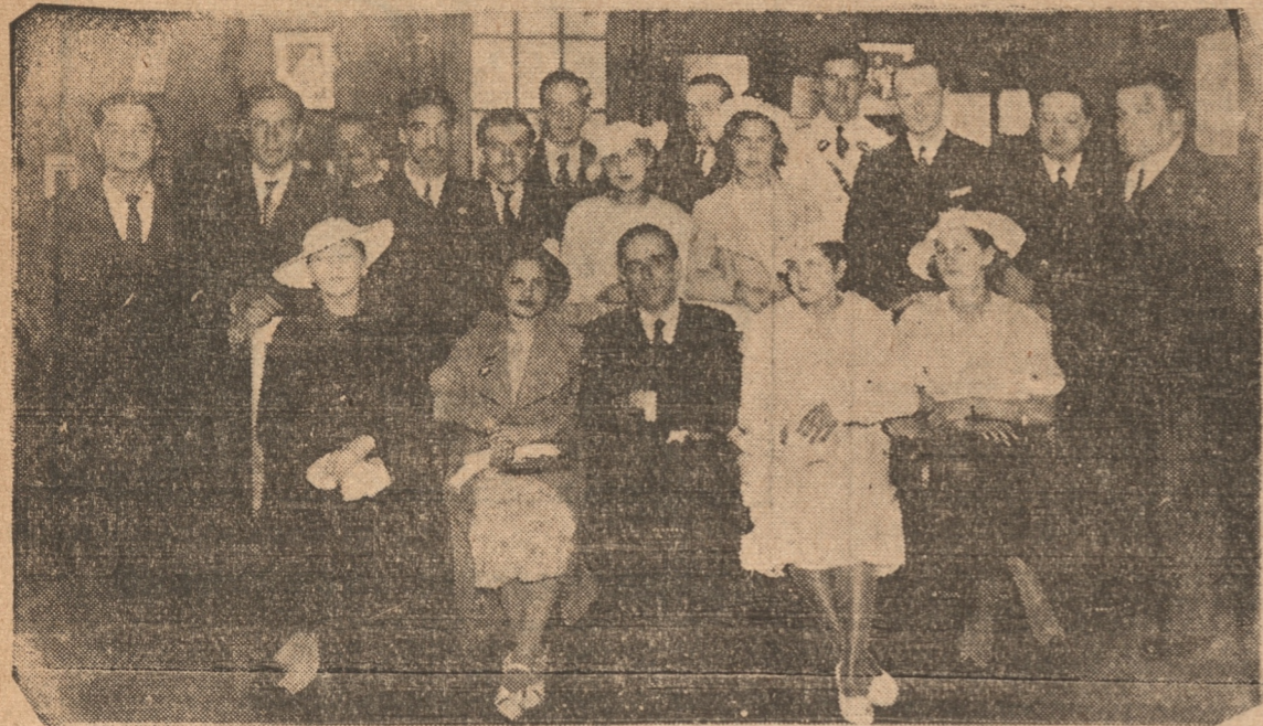
S. M. Eliana y su Corte de honor durante su visita a La Patria

Acompañada de su corte de honor estuvo ayer en nuestra casa