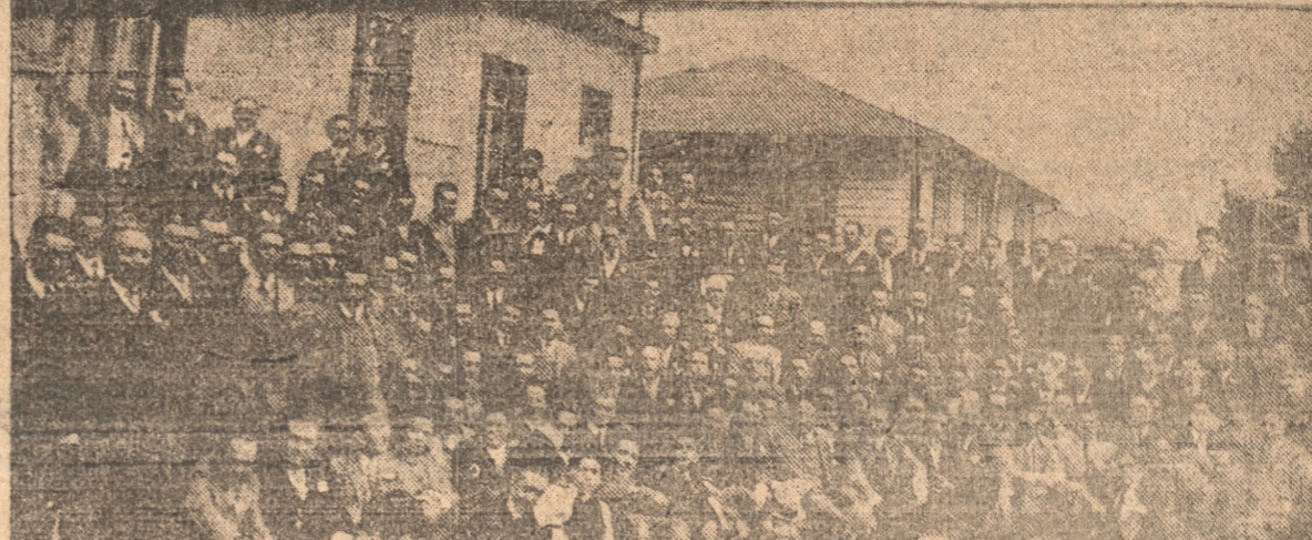
GRUPO GENERAL DE LOS ASISTENTES AL PASEO EFECTUADO AYER POR LOS FERROVIARIOS A LA ISLA QUIRIQUINA

SANTIAGO, 27.— Habiéndose últimamente rumoreado que se había firmado un tratado secreto entre Chile y Brasil para evitar que se atropelle la neutralidad del Ecuador en el conflicto colombiano-peruano, la Cancillería lo ha desmentido, expresando que nada hay que autorice pensar semejante cosa, pues todo tratado secreto es contrario a la política internacional chilena.