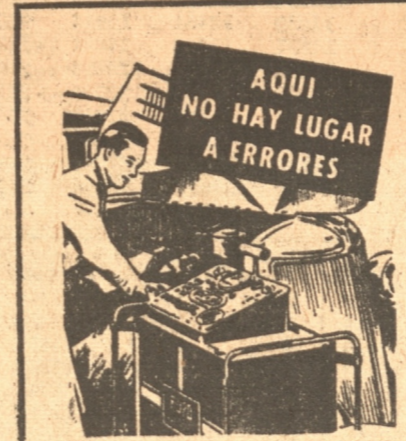
El Aparato de Pruebas de Laboratorio es típico del equipo moderno con que cuentan los Concesionarios Ford. Rápido, exacto y científico, nunca deja lugar a dudas.

Cuando se haga necesario reparar su Ford, Ud. querrá la misma calidad de materiales y la misma esmerada mano de obra que la de las piezas originales. Los Repuestos Ford Legítimos aseguran a Ud. estas ventajas, pues son producidos con las mismas máquinas y por los mismos operarios. Para tener la certeza de conseguir esta calidad Ford, tanto en las piezas como en su instalación, lleve Ud. su automóvil al Concesionario Ford. El Concesionario Ford cuenta con un taller de primer orden. Sus mecánicos son verdaderos expertos. Su equipo, moderno, completo y de gran precisión, asegura un servicio rápido y eficiente.