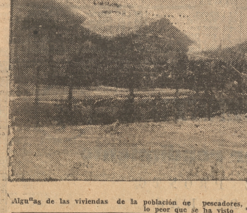
Algunas de las viviendas de la población de pescadores, donde la habitación obrera es lo peor que se ha visto