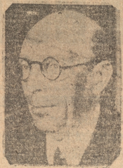
Señor RICARDO SAMPER, que ayer entregó la renuncia del Gabinete a Alcalá Zamora.

Se realizará en febrero próximo en Peñuelas Bajo los auspicios de la Sociedad Agrícola del Norte y con la cooperación de todas las sociedades mineras, comerciales e industriales de Coquimbo y Antofagasta, se realizará en febrero una exposición agrícola, industrial y minera de ambas provincias. La exposición se verificará en el balneario Peñuelas, y coincidirá con la inauguración del Casino que ha levantado allí la Empresa de los Ferrocarriles en cooperación con las Municipalidades de La Serena y Coquimbo.