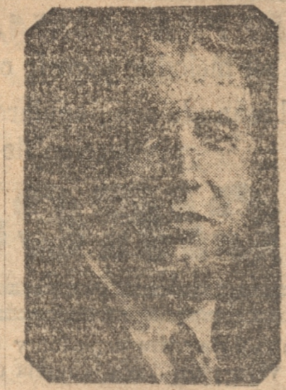
FILIBERTO VILLALOBOS, Ministro que desempeñaba la Cartera de Instrucción.