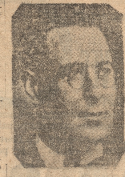
VICENTE CANTO, Ministro de Justicia, que también renunció ayer.

Se teme que haya sido víctima de los temporales La Superioridad Naval pidió noticias a los gobernadores y subdelegados marítimos del país sobre el navegante solitario capitán Hansen. Asimismo diversas embarcaciones han recorrido últimamente la costa. Desde las respuestas no se sabe que se ignore su paradero; se teme que haya sido víctima de los temporales, salvo que haya recaído en alguna caleta inhospitable.