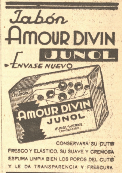
CONSERVARÁ SU CUTIS FRESCO Y ELASTICO. SU SUAVE Y CREMOSA ESPUMA LIMPIA BIEN LOS POROS DEL CUTIS Y LE DA TRANSPARENCIA Y FRESCURA.