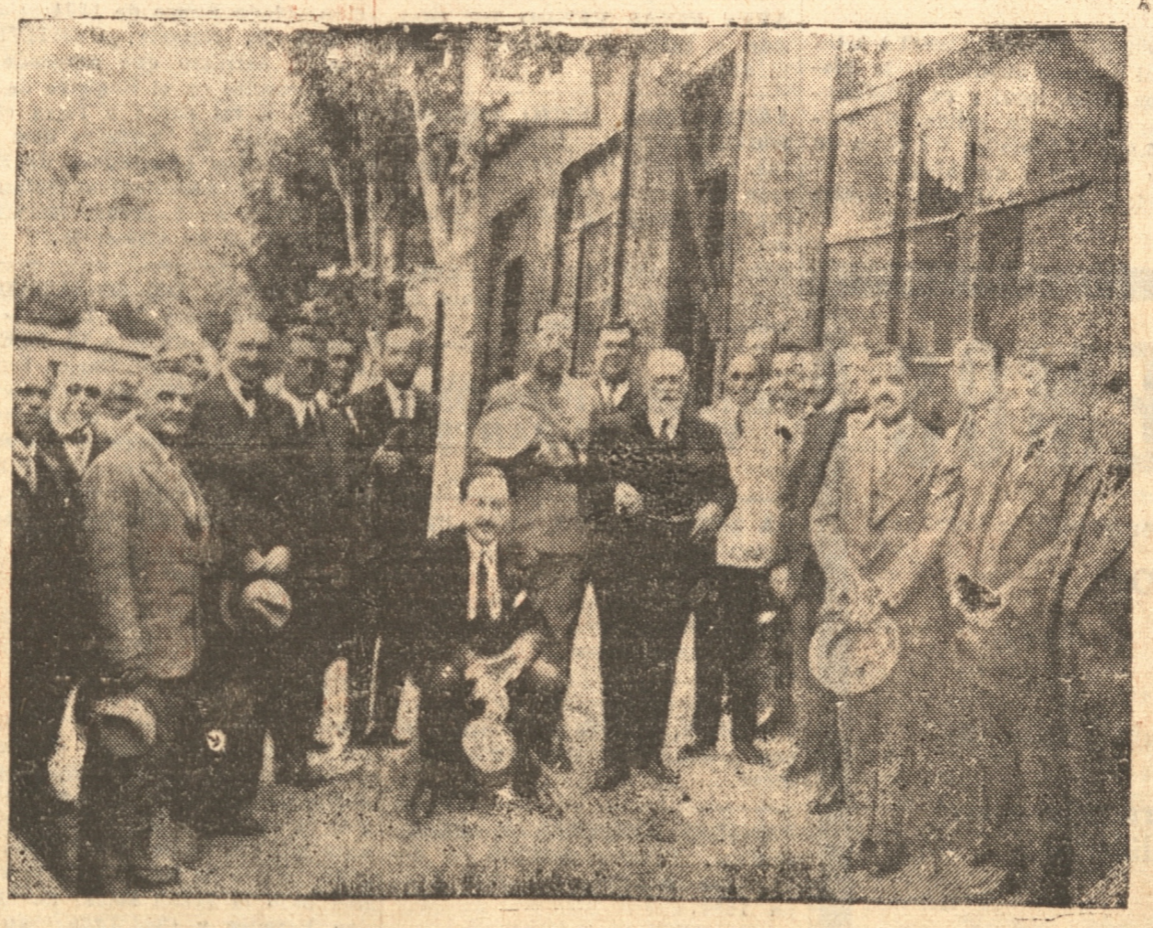
GRUPO GENERAL DE LOS ASISTENTES A LA MANIFESTACION