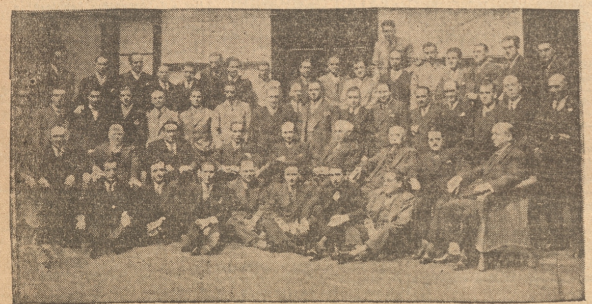
ASISTENTES A LA COMIDA DE AYER EN EL CENTRO ESPAÑOL

Ayer, en el Centro Español, se efectuó la comida anual con que los hijos de La Rioja, celebran el día de San Mateo.