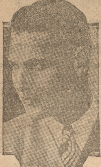
RICHARD ARLEN in the Paramount Picture "Burning Up"

Richard Arlen - Chester Morris - Genevieve Tobin en