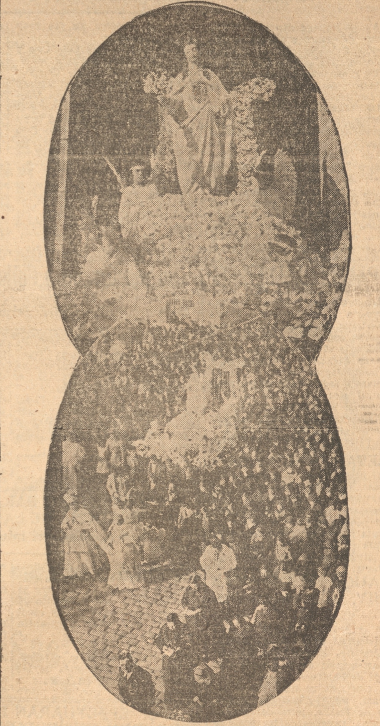
DOSS VISTAS DE LA PROCESION DE AYER

POLITICA LOCAL PARTIDO DEMOCRATA. AGRUPACION DE CONCEPCION Por acuerdo del H. Directorio, en su sesión celebrada el 22 del presente se acordó convocar a asamblea extraordinaria para el próximo miércoles a las 18.30 horas en el local de la casa Caupolicán N.º 755. En esta asamblea se conocerá un acuerdo del directorio relacionado con la próxima convención a celebrarse en Temuco.