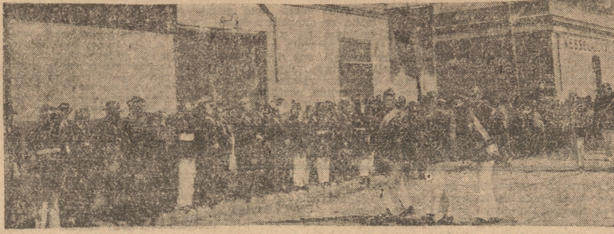
DURANTE EL DESFILE DE LAS COMPANIAS