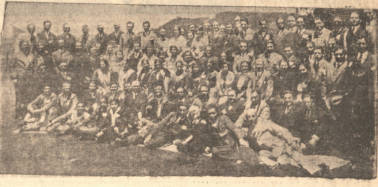
GRUPO GENERAL DE LOS ASISTENTES