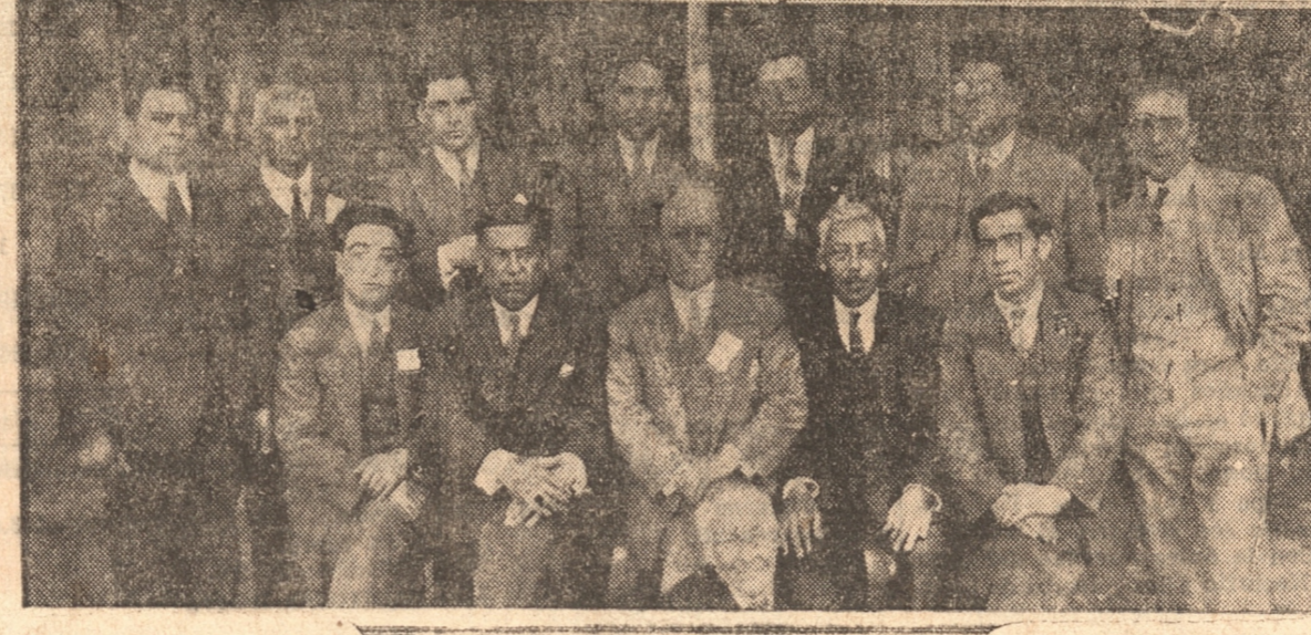
EL DIRECTORIO DE LA INSTITUCION

Los hombres que tienen la directiva en el presente año de nuestra institución, supieron comprender desde el primer momento la gran responsabilidad y la ruda tarea que se echaron sobre sus espaldas y todos como un solo brazo han trabajado con el mayor entusiasmo al programa de trabajo que nos trazáramos, labores que no voy a enumerar en estos momentos por no ser la ocasión y