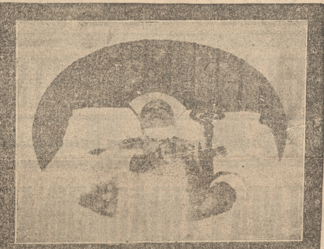
MONSEÑOR SEPULVEDA EN EL LECHO MORTUORIO

PERSONAS QUE RODEABAN EL LECHO En los momentos que expiró