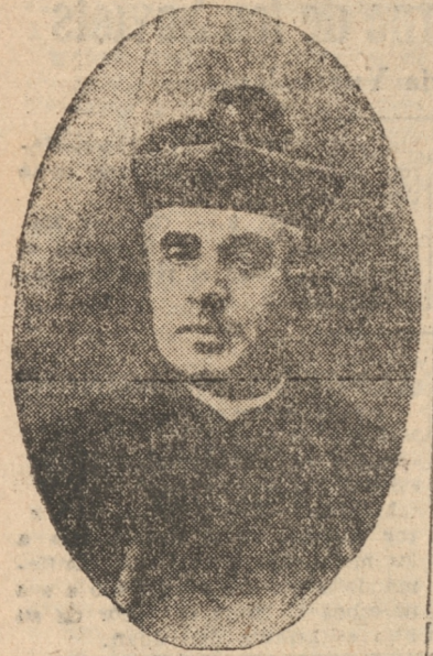
El Obispo Monseñor Sepúlveda antes de su consagración episcopal

LOS AUXILIOS RELIGIOSOS El martes en la mañana le