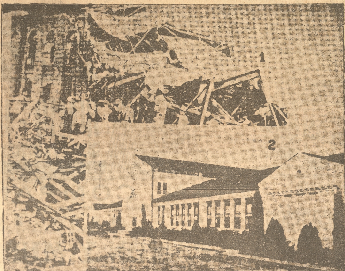
El edificio de la Escuela Rural de New London, antes de la explosión y después que ocurrió la catástrofe.

La horrible explosión en los edificios que componían la Escuela Rural de New London. — Un gas que es más mortífero que la dinamita. — Hechos heroicos que se narran a raíz de esta desgracia que ha conternado a todo el mundo. — (Por la vía aérea)