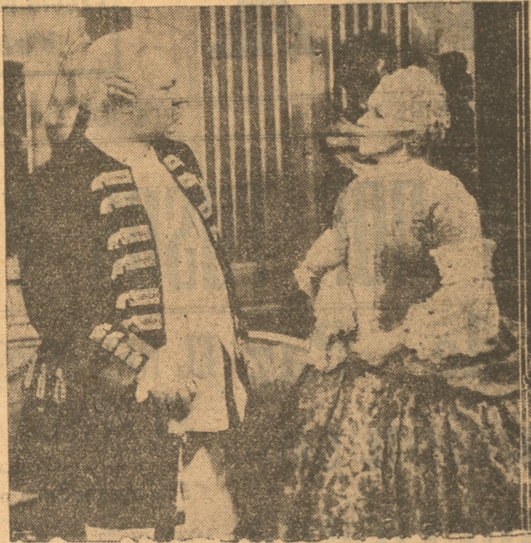
El vigoroso y apasionante drama histórico