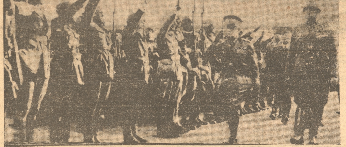
Victor Manuel III revista a los legionarios italianos que lucharon en los frentes españoles y que fueron evacuados hace poco tiempo.

MADRID. — (UP). — Aviones nacionalistas intentaron un raid sobre esta ciudad, pero fueron puestos en fuga por la artillería anti-aérea.