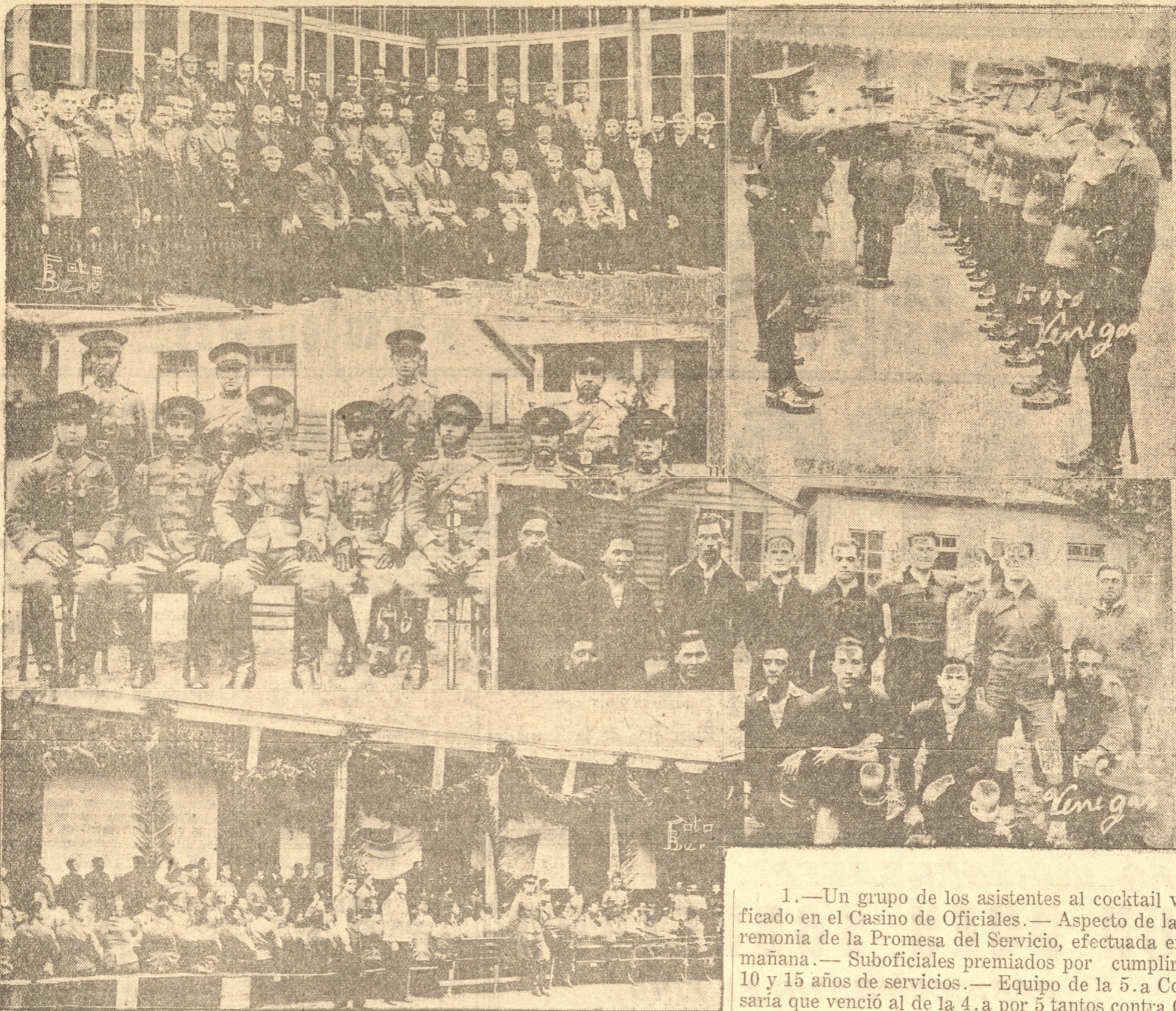
1.—Un grupo de los asistentes al cocktail verificado en el Casino de Oficiales. — Aspecto de la ceremonia de la Promesa del Servicio, efectuada en la mañana. — Suboficiales premiados por cumplir 5, 10 y 15 años de servicios. — Equipo de la 5.ª Comisaría que venció al de la 4.ª a por 5 tantos contra 0 en el partido jugado en la Avenida Collao. — Durante el almuerzo en la 5.ª Comisaría.

carabineros por nuestras calles fué presenciado por un público numeroso que tributó sus aplausos a los abnegados servidores del orden público.