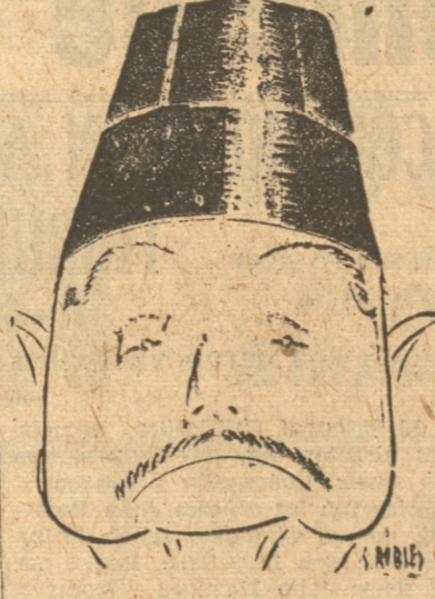
rosas del mundo. Seis mil de sus súbditos viven dedicados a la atención del Sultán y de sus mujeres y familias.

Paku Buwono ostenta con orgullo un centenar de condecoraciones que luce todas sobre su pecho y parte de los costados, porque el hombre es elástico y las condecoraciones grandes. Dicen que Paku Buwono es un hombre de cultura y perfectamente informado de lo que ocurre en el mundo. Sin embargo, se quedó hace poco al Cónsul de los Estados Unidos porque el soberano de este país no le había otorgado ninguna condecoración.