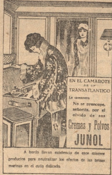
A bondad sin existencia de ese mismo producto para neutralizar los efectos de las brumas marinas en el cutis delicado.

Quizá, si las excavaciones se llevan adelante, Cádiz, emporio fenicio, proporcione a los arqueólogos sorpresas gratas, por medio de las cuales se descubran detalles de la civilización fenicia.