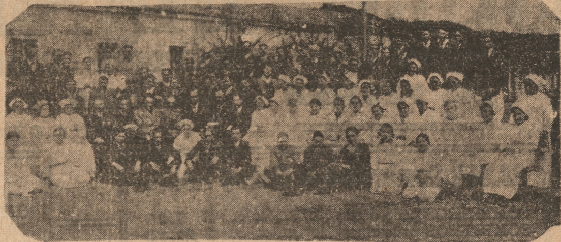
VISTA TOMADA AYER DURANTE LA CELEBRACION DEL "DIA DEL HOSPITAL"

MOMENTOS DE ALEGRIA, ENTRE SUS DOLORES, VIVIERON AYER LOS ENFERMOS DEL ESTABLECIMIENTO. — LOS ACTOS REALIZADOS EN CELEBRACION DEL "DIA DEL HOSPITAL"