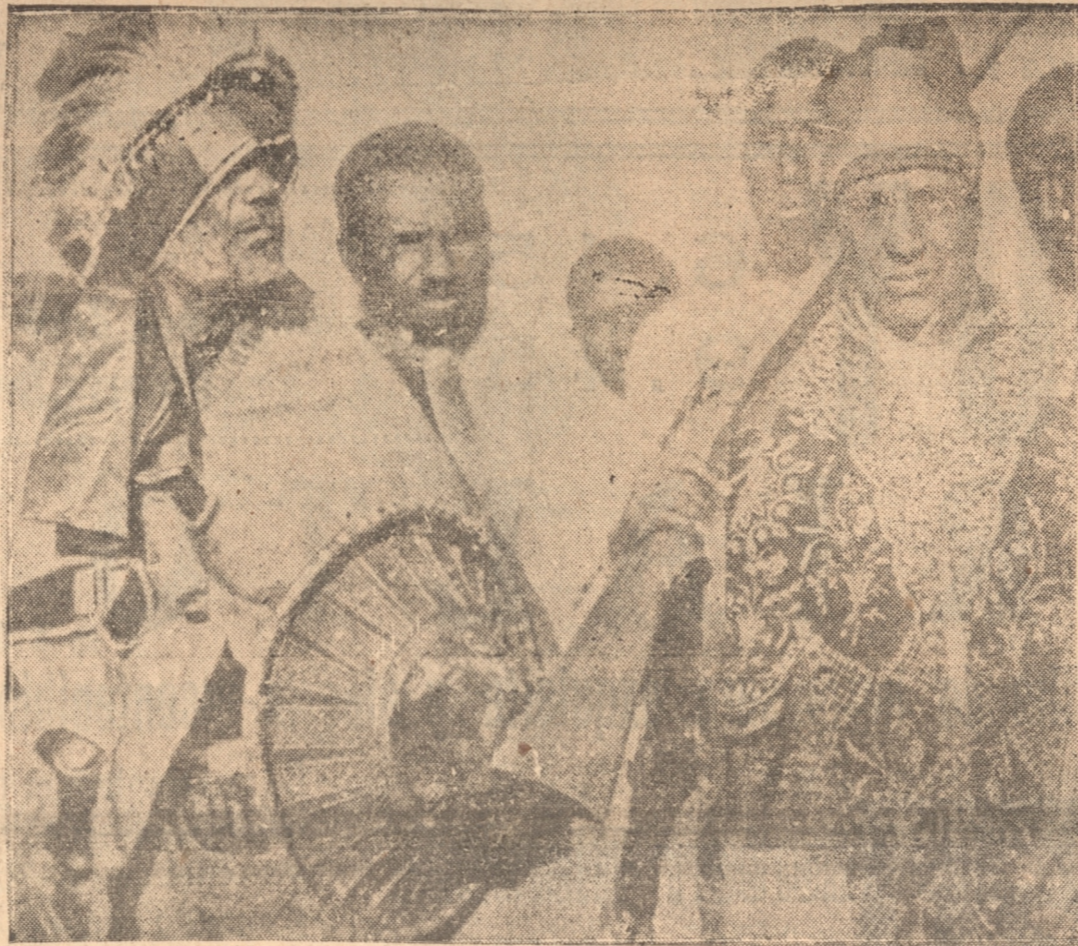
EL NEGUS CON SU ARMADURA DE GALA, acompañado de algunos jefes de su ejército, el día de la inauguración de su monumento en Addis Abeba.

El Negus envió telegrama a la Liga de las Naciones protestando de la actitud italiana. — Italia informó a la SDN del movimiento de sus tropas, invocando la urgente necesidad de movilizarlas ante la actitud agresiva del ejército de Abisinia