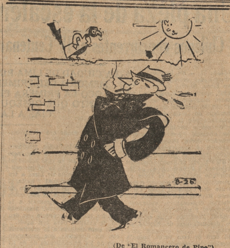
(De "El Romancero de Pipo").

BANCO CENTRAL: Dólar 19.40; Esterlina 94.82; Franco 1.288; Franco Sulzo 6.288; Lira 1.653; Belga 4.517; Marco 7.766; Peseta 2.641; Corona Sueca 4.882; Corona Checoslovaca 0.805; Corona Danesa 4.229; Florin Holandés 1.3065; Schilling Austriaco 3.628; Oro 400. BOLSA NEGRA: Dólar Exportación 23.80; Cable 23.70; Cheque 23.50; Esterlina Exportación 118; Cable 115; Cheque 114 1/2; Nacional 6; Franco 1.56; Peseta 3.20; Lira 2; Oro 478.