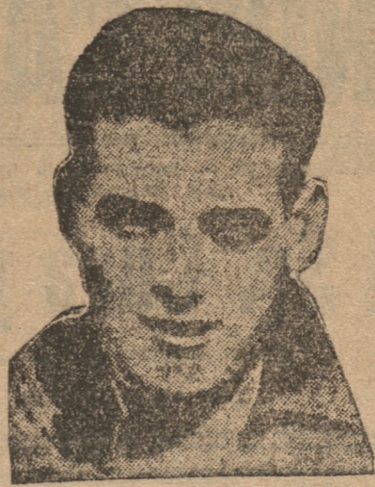
WILSON, SOBRERO BACK ARGENTINO

TAMPA (Florida), enero 22. (U. P.). — Ante diez mil espectadores, el campeón mundial de todos los pesos, Max Baer, hizo con el campeón local, Tommy Canella, una exhibición de cuatro rounds. El campeón causó una pésima impresión, pues apareció flojo y falta de entrenamiento, habiendo absorbido repetidos punches que le aplicó Canella, golpes que sin embargo, fueron demasiado débiles para provocar en Baer la furia que experimenta cuando le aplican golpes fuertes. Durante los cuatro rounds, el campeón se dedicó, como siempre, a hacer el payaso, divirtiéndose a la multitud.