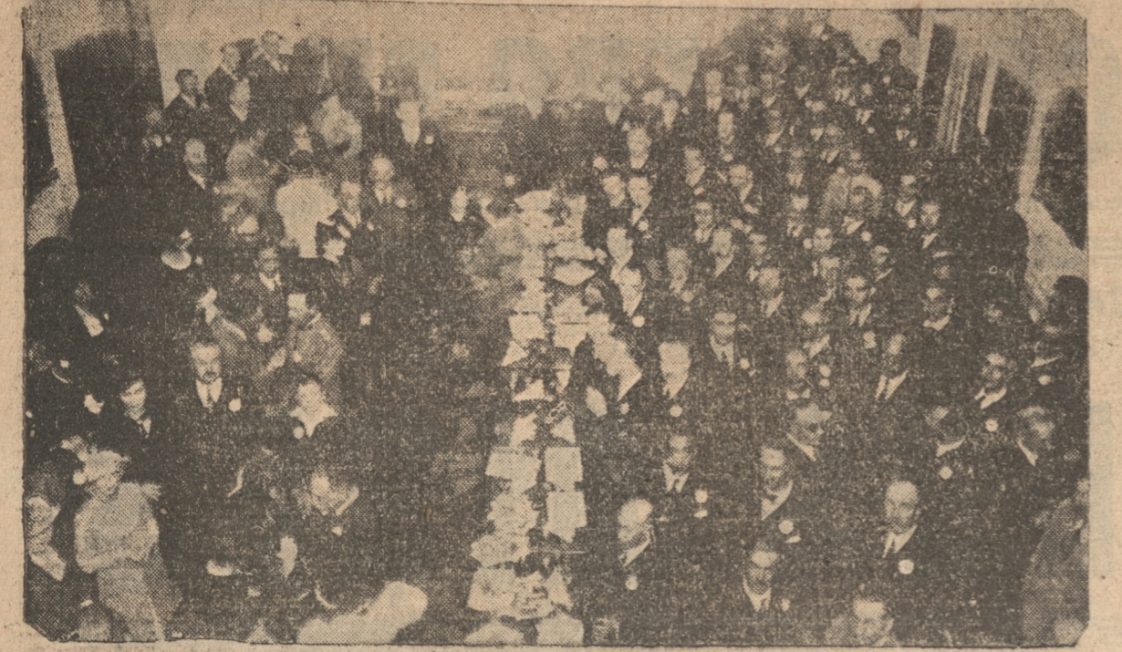
ANTES DE LA COMIDA EN EL CLUB CONCEPCION