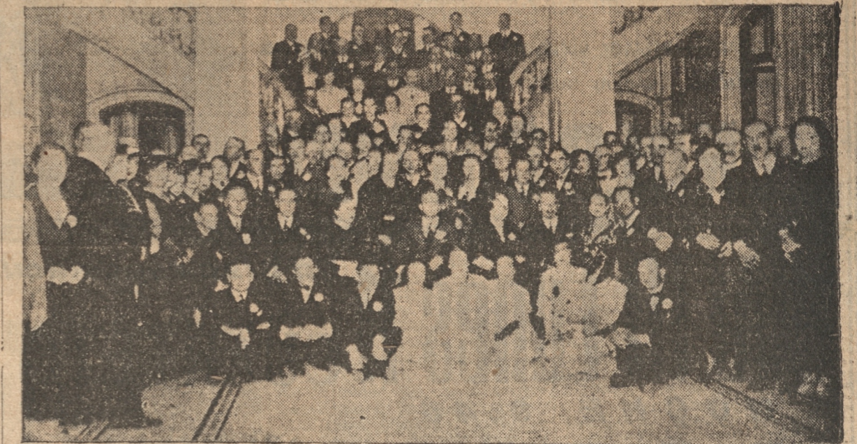
VISTA PARCIAL DE LOS ASISTENTES A LA RECEPCION EN LA MUNICIPALIDAD

En los salones del segundo piso, se establecieron los comedores, en los que tomaron colocación más de 256 personas, entre