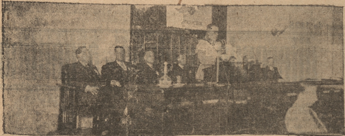
LA MESA DIRECTIVA EN LA SESION INAUGURAL