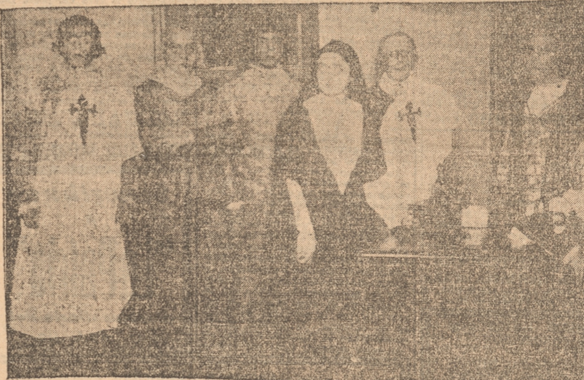
MARIA GUERRERO Y FERNANDO DIAZ DE MENDOZA CON ALGUNOS DE SUS COLABORADORES EN "DOÑA MARIA LA BRAVA"

de tan antiguo y que vive en cada uno de los pobladores de la Península. Les repito, nada tengo contra la República, y si ella ha de llevar a España a la felicidad que sea en hora buena, y dejémosla que labore; el bien de la patria está por sobre todas las cosas.